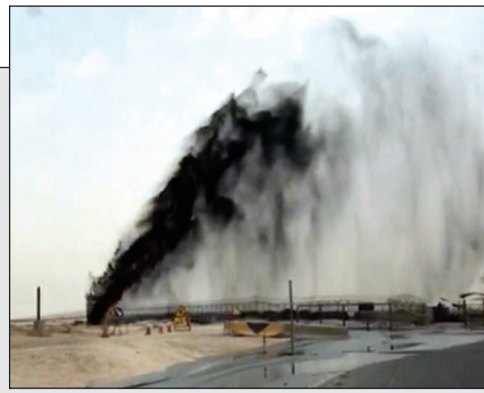
جانب من التسريب النفطي في شمال الكويت

السيطرة على تسريب الرتقة النفطية دون إصابات أو أضرار بيئية 28