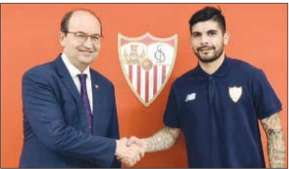
بانيفا يعود لإشبيلية بعد تجربة فاشلة في إنتر ميلان

أعلن نادي إشبيلية الإسباني عن ضم لاعب الوسط الأرجنتيني إيفر بانيفا، من صفوف إنتر ميلان الإيطالي. وذكر إشبيلية الشهر الماضي أنه توصل لاتفاق مبدئي مع بانيفا من أجل عودته إلى ملعب رامون سانتشيز بينخوان بعقد يمتد لثلاثة أعوام. وأكد إنتر ميلان من جانبه إتمام الصفقة التي يعتقد أنها تكلفت تسعة ملايين يورو. وانتقل بانيفا إلى إنتر ميلان في 2016 لكنه لم ينجح في ترسيخ أقدامه مع الفريق حيث شارك في 22 مباراة فقط على مستوى كل المسابقات في الموسم الماضي. وقاز بانيفا (29 عاما) بلقب الدوري الأوروبي مع إشبيلية مرتين متتاليتين في 2014/2015 و 2015/2016.