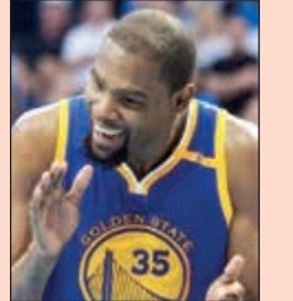
بقاء العملاق مع ستيت

توصل كيفن دورانت وفريقه غولدن ستيت ووريترز المتوج بطلا لدوري كرة السلة الأميركي للمحترفين للمرة الثانية في غضون ثلاثة أعوام، إلى اتفاق يقضي بتوقيع عقد جديد بين الطرفين لمدة عامين مقابل 53 مليون دولار، بحسب ما كشفت شبكة «اي اس بي ان» الرياضية.