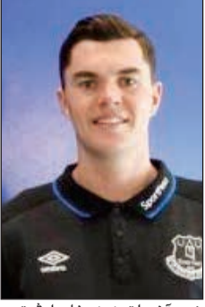
نجم آخر لتعزير دفاع إيفرتون

ودفع إيفرتون حوالي 30 مليون جنيه إسترليني لضم مايلك كين مدافع بيرنلي ليصل إجمالي ما أنفقه خلال الصيف الجاري إلى أكثر من 90 مليون جنيه إسترليني، على أمل أن يبني تشكيلة قادرة على الوجود في المربع الذهبي للدوري بالموسم الجديد.