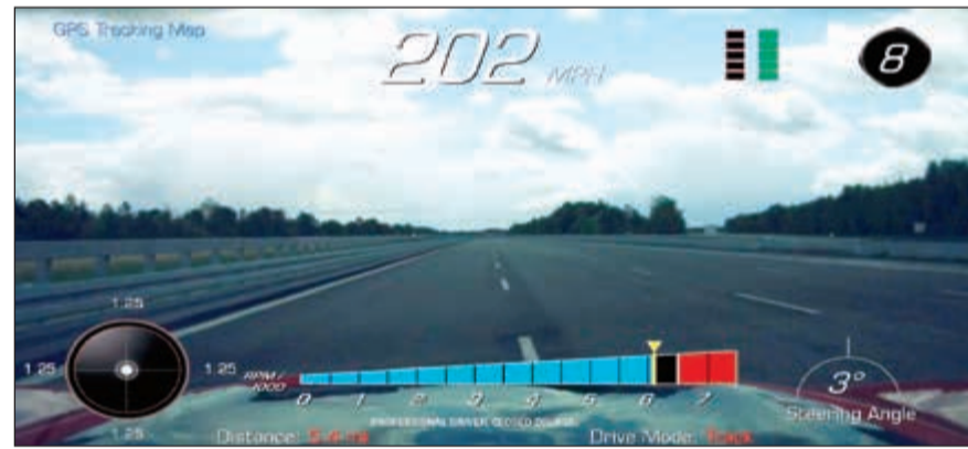
سرعة ZL1 تجاوزت الـ 200 ميل/س (321 كلم/س)