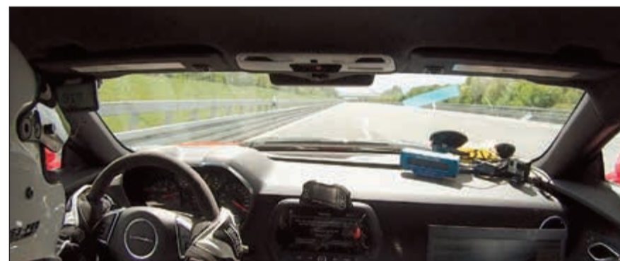
من داخل مقصورة القيادة خلال التجربة

قامت شيفروليه مؤخرا باختيار قدرات أداء سيارة كامارو ZL1 كوبيه، أسرع سيارة من طراز كامارو على الإطلاق بسرعة قصوى تبلغ 318 كيلومترا في الساعة، على حلبة بابنبورغ للسرعات العالية في ألمانيا. واختارت التحفة الهندسية الجديدة جميع الاختبارات بنجاح بفضل ما تتمتع به من مواصفات مذهلة، وباتي التسارع من محرك V8 سوبر تشارج سعة 6,2 ليترات يولد قوة تبلغ 650 حصانا مدعوماً بناقل حركة أوتوماتيكي بعشر سرعات، مما يتيح لها الانطلاق من 0-100 كلم/ساعة خلال 3,5 ثوان فقط.