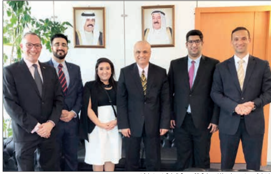
المشاركون في زيارة للقطعة المصرفية العامة في فرانكفورت

في إطار برنامجه لتطوير الخريجين «أجيال»، قام بنك الخليج مؤخرا باختيار ثلاثة من المتقدمين المشاركين في البرنامج لخوض برنامج تدريبي مدته 4 أسابيع لدى مؤسسات مالية رائدة في فرانكفورت بألمانيا. وقام بنك الخليج بتأسيس برنامج تطوير الخريجين «أجيال» بالتعاون مع معهد الدراسات المصرفية بهدف تعزيز ودعم المواهب الكويتية الشابة وتجهيزهم لمهامهم في المستوى «المصرفي الشامل» وتولي مناصب قيادية بالبنك في المستقبل. وقد تم تخريج ثلاث دفعات ضمن البرنامج منذ إنطلاقه.