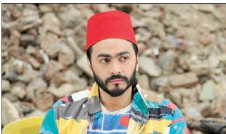
تامر حسني في فيلم «تصبح على خير»

الفيلم وتركيز كل طاقته ووقتها في «الحرباية» ولتستطيع للحاق بالموسم