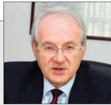
السفير اليوناني أندريس باباداكيس (ريليش كومان)

رئيس اتحاد التعاونيات علي الكندري لـ «الأنباء»: سنحارب أي زيادة مصنعة في الأسعار 10