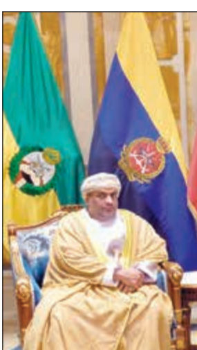
صاحب السمو الأمير الشيخ صباح الأحمد مستقبلاً يوسف بن علوي بحضور سمو ولي العهد الشيخ نواف الأحمد وسفير عمان حامد بن سعيد

في الكويت والحوارات التي ستجرى بيننا». ولاحقاً شدد وزير خارجية قطر الشيخ محمد بن عبد الرحمن آل ثاني على أن عقوبات الدول العربية تجاه بلاده إجراءات غير قانونية بذريعة مكافحة الإرهاب، وقال: الرد على مطالب الدول الأربع