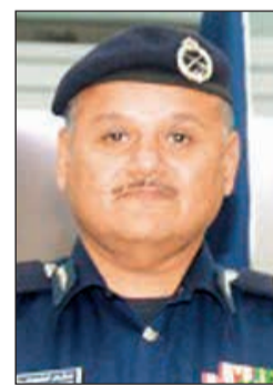
اللواء جمال البليهيس

أعلن نائب مدير عام الإدارة العامة للإطفاء لشؤون المكافحة اللواء جمال البليهيس عن استعداد شعبة التعمد في حريق بنك الائتمان في منطقة جنوب السرة، والذي شب نهاية شهر رمضان الماضي.