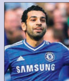
صلاح عاد لإنجلترا بعد الرحيل عن البليز