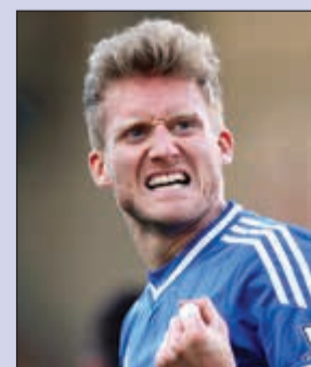
شورله رحل إلى فولفسبورغ الألماني