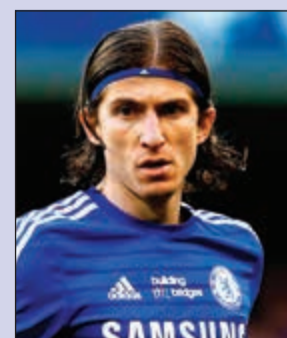
لويس ريج لناديه السابق أتلتيكو مدريد

استطاع نادي تشلسي تحقيق عائدات مالية ضخمة بعد بيعه عددا من لاعبي فريقه المتواجدين على الدكة لأندية أخرى.