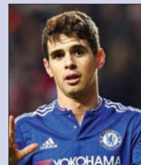
أوسكار حقق أكبر ربح للنادي الإنجليزي

هذا، ووجدت إدارة تشلسي في هذه السياسة مكاسب مالية عديدة سمحت لها باستعادة على الأقل جزء من الأموال التي أنفقتها في سبيل انتدابهم، وتقليص فاتورة الرواتب، مع توفير السيولة اللازمة لإبرام صفقات جديدة. كما حقق تشلسي بفضل هذه السياسة مكاسب فنية كبيرة تمثلت في التخلص من لاعبين لا يدخلون في خطط الجهاز الفني لـ«البلوز».