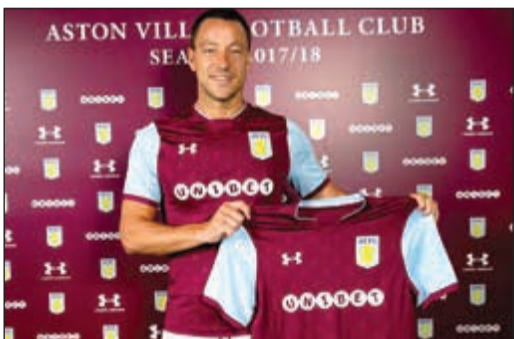
تيري حاملا قميص فريقه الجديد أستون فيلا

أعلن مالك أستون فيلا أمس تعاقد مع جون تيري قائد تشلسي ومنتخب إنجلترا السابق لينضم إلى النادي المنافس في دوري الدرجة الثانية. وقال توني شيا على تويتر في إشارة إلى غريمه في المدينة برمنغهام سيتي الذي رغب أيضا في التعاقد مع اللاعب البالغ من العمر 36 عاما «مرحبا بك جون تيري في أستون فيلا. الإعلان الرسمي سيصدر بعد قليل». وأصبح من حق تيري الانضمام إلى أي فريق في صفقة انتقال حر مطلع الأسبوع بعد 22 عاما قضاها في ستامفورد بريدج شهدت سنوات لعبه كلها في الدوري الممتاز. وذكرت صحيفة «برمنغهام ميل» وصحف أخرى أن تيري وقع عقدا لمدة عام واحد وطار بالفعل إلى المعسكر الإعدادي للموسم مع أستون فيلا في البرتغال.