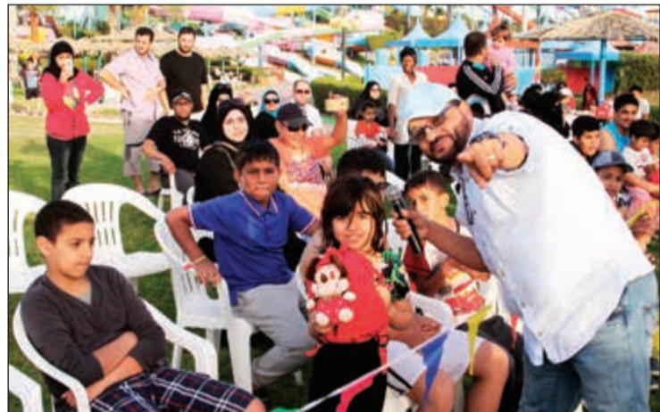
فرح طفلك بهدية الأكوإبارك