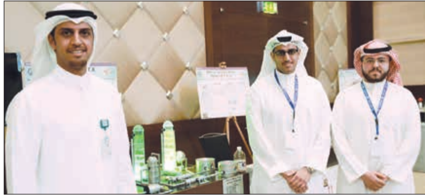
عدد من الطلبة أمام مشروع تخرجهم

تعاون وشراكة لدعم الشباب، بما يعكس الالتزام الراسخ تجاه الشباب الذي يراه البنك عماد الحاضر والمستقبل، والحرص المستمر على تنظيم العديد من الفعاليات والأنشطة المعنية بهم.