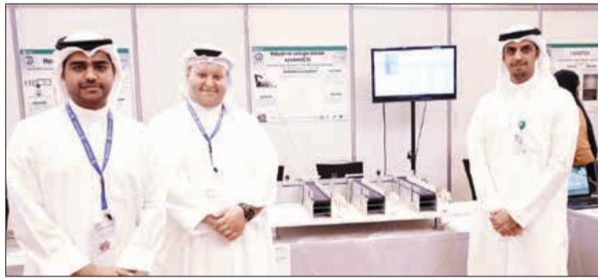
أحد مشاريع التخرج