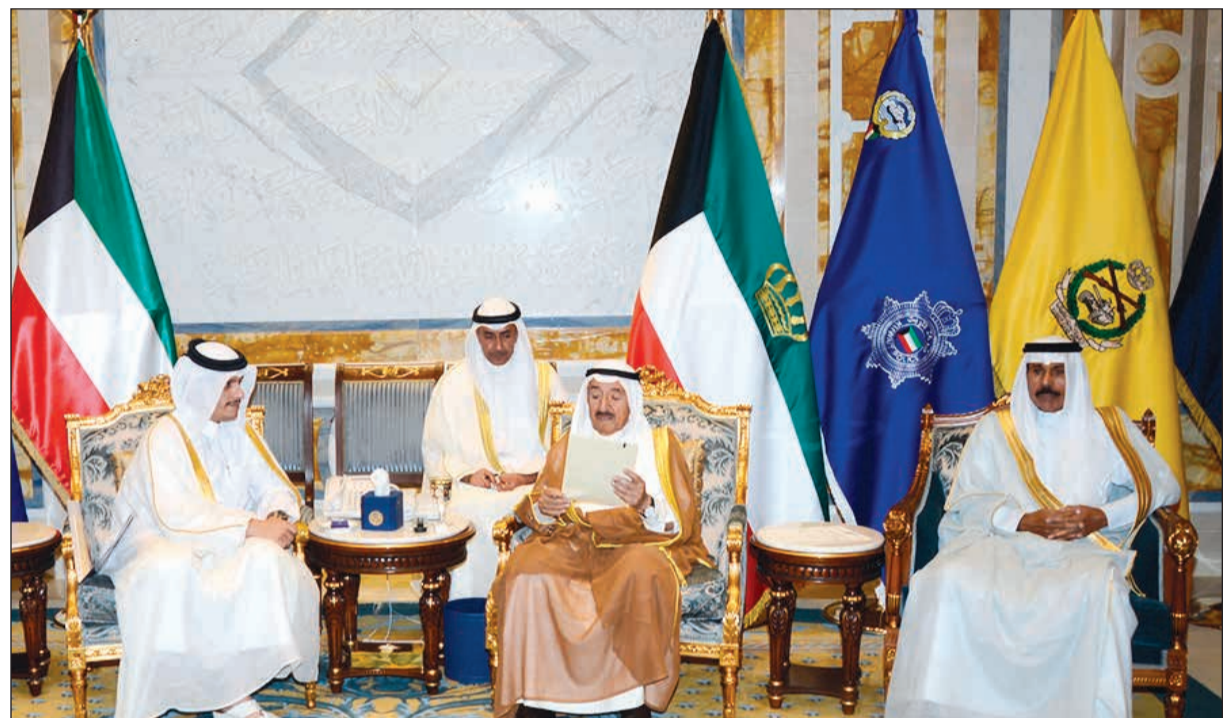
صاحب السمو الأمير الشيخ صباح الأحمد يتسلم رسالة أمير قطر - بحضور سمو ولي العهد الشيخ نواف الأحمد - لدى استقباله وزير الخارجية القطري الشيخ محمد بن عبد الرحمن أمس