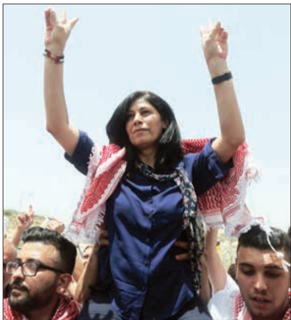
النائبة خالدة جرار - التي اعتقلها الاحتلال امس - خلال تظاهرة في الضفة مطلع يونيو الماضي

وأفاد الجيش الإسرائيلي في بيان امس بأنه «تم اعتقال جرار لأنها استأنفت أنشطتها في الجبهة الشعبية لتحرير فلسطين وليس بسبب صفتها نائبة» في المجلس التشريعي الفلسطيني. في غضون ذلك، بدأ بإسفل غطاس النائب السابق في الكنيست تنفيذ عقوبته بالسجن عامين إثر ادانته بتسليم هواتف جواله لاسريين فلسطينيين بحسب متحدثة باسم إدارة سجون إسرائيل امس. وفي مقابل الدفع بأنه مذنب، اقترح الادعاء العام عقوبة السجن لعامين لغطاس بدلا من حكم قد يصل الى السجن لعشرة أعوام. وأودع غطاس سجن جيلولا في شمال إسرائيل