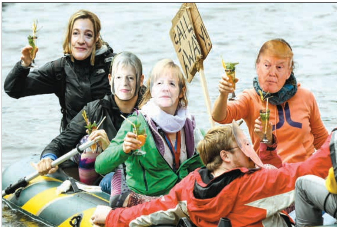
مظاهرون المان يرتدون اقنعة لبعض قادة مجموعة العشرين خلال فعالية مناهضة للقمّة المقبلة في هامبورغ الاسبوع المقبل