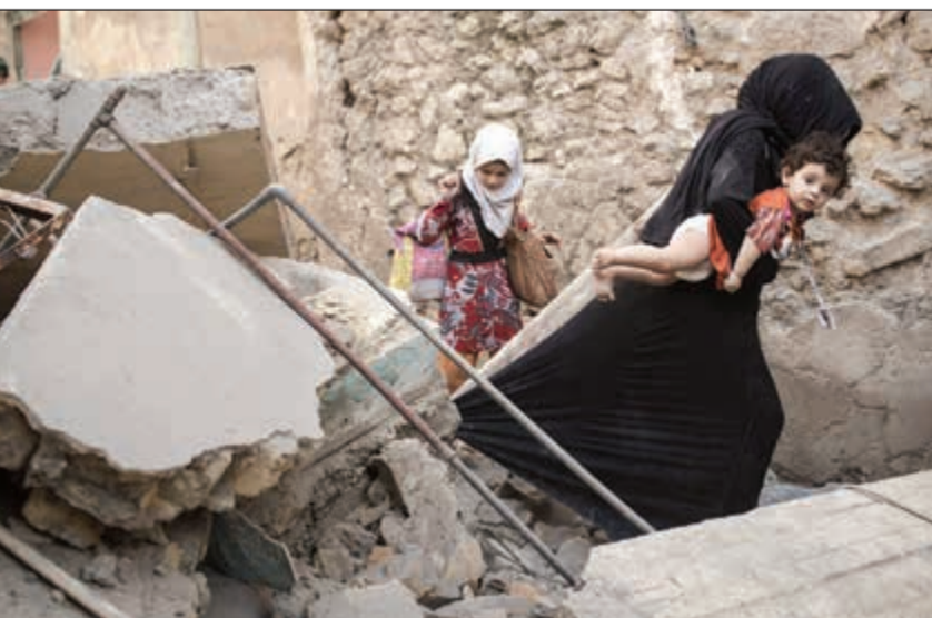
عراقية واطفالها الصغار يمرّون بين انقاض المنازل المهدمة خلال مغادرتهم الموصل القديمة امس

المقربين جدا من البغدادي الجمعة الماضية، في أحد مساجد تلعفر لحت بشكل واضح لقتل البغدادي، ما أثار جدلا واسعا. ولفقت إلى أن لجوء «داعش» لفرض هذه العقوبة يأتي تحسبا لحصول انشقاقات أو انهيارات في صفوفه أو نشوب اقتتال داخلي للاستحواذ على المناصب نظرا لوجود إشكالات وخلافات واسعة داخل صفوف التنظيم. وكشف مصدر محلي في نيوى أن مسلحي «داعش» اعتقلوا «أبوقتيبة» بعد يوم من تلميحه لقتل زعيم التنظيم في خطبة الجمعة. ميدانيا، واصلت القوات العراقية المسيطرة على مساحات جديدة من المدينة القديمة في غرب الموصل، في إطار عملياتها لطرز التنظيم المتطرف من آخر مواقعه في ثاني أكبر مدن العراق.