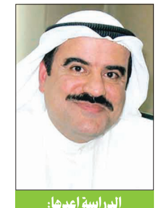
الدراسة أعدها: أ.د. طارق الدويسان

حققت الكويت انجازاً طيباً بتقدمها 11 مركزاً في دليل الابتكار العالمي، لتحتل المركز الـ 56 عالمياً (من أصل 127 دولة) والمركز الـ 4 عربياً وخليجياً، متقدمة بذلك مركزاً واحداً عن العام الماضي عربياً وخليجياً.