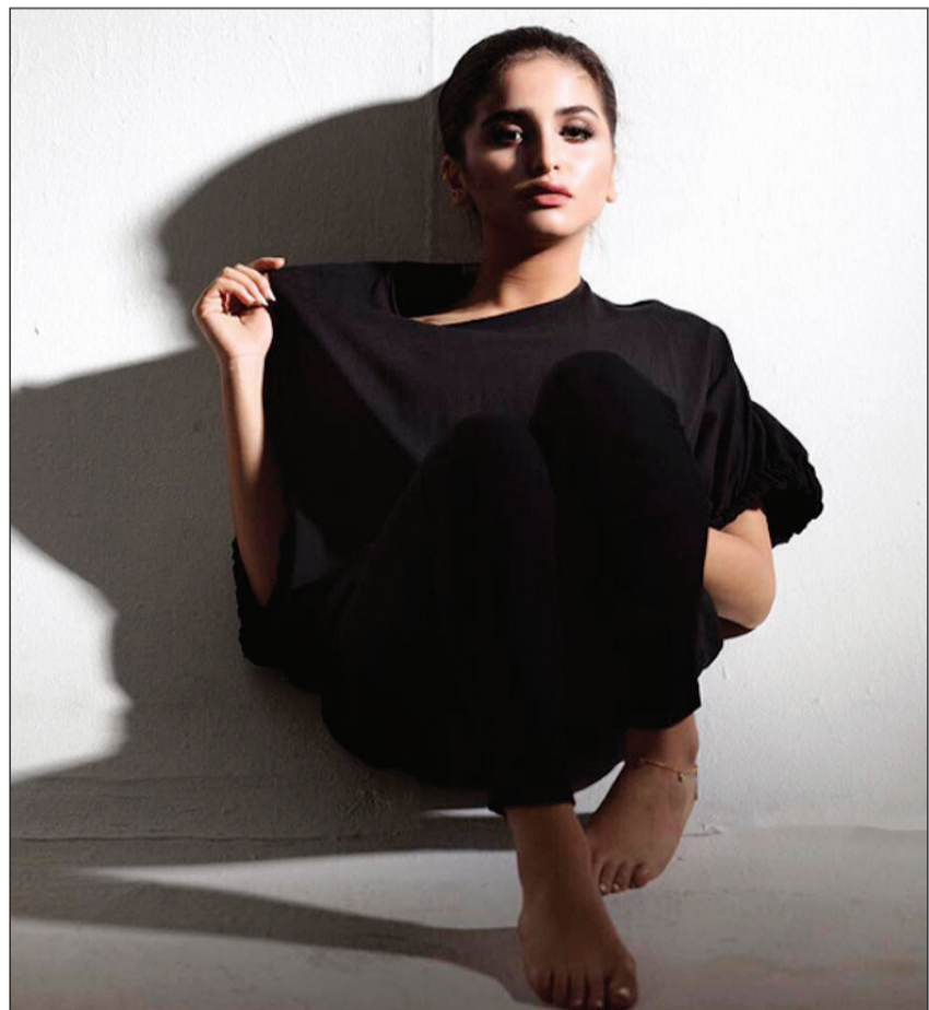
حلا الترك ترتدي الأسود

بعد الأزمة الأخيرة التي حدثت بينها وبين والدها محمد الترك، والتي أدت إلى تبرئه منها، خضعت الفنانة البحرينية حلا الترك لجلسة تصوير جديدة، ظهرت فيها مرتدية ملابس باللون الأسود، وتجمع شعرها إلى الخلف، في إطلالة حزينة.