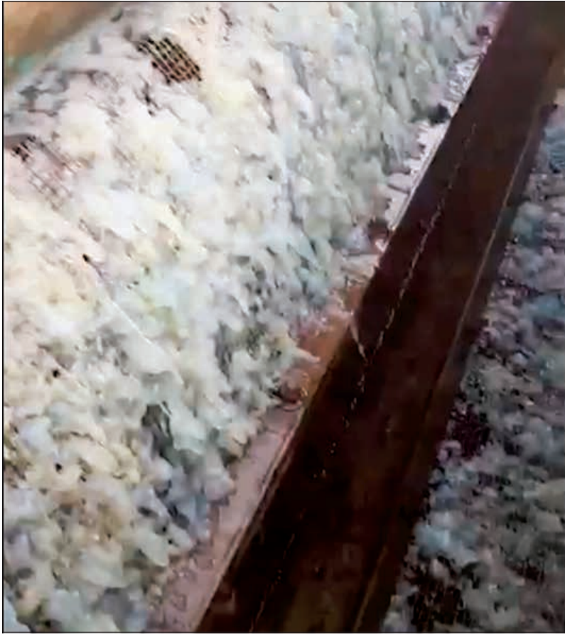
تجمع كبير من القناديل على الشبكات الدوارة في المحطة