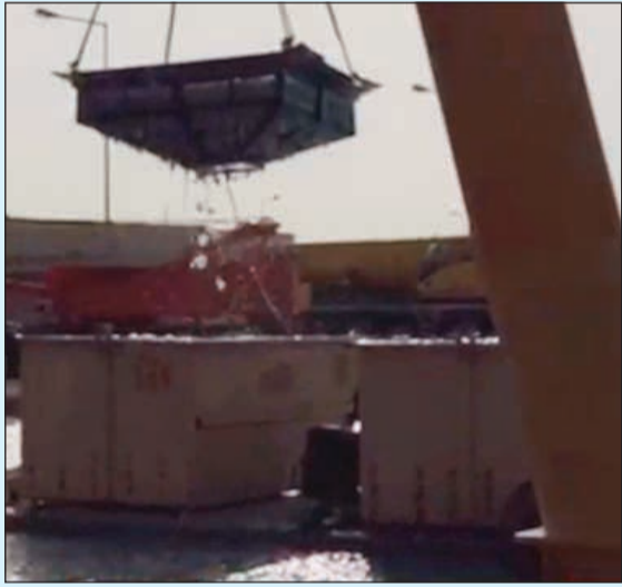
من عمليات تنظيف المياه