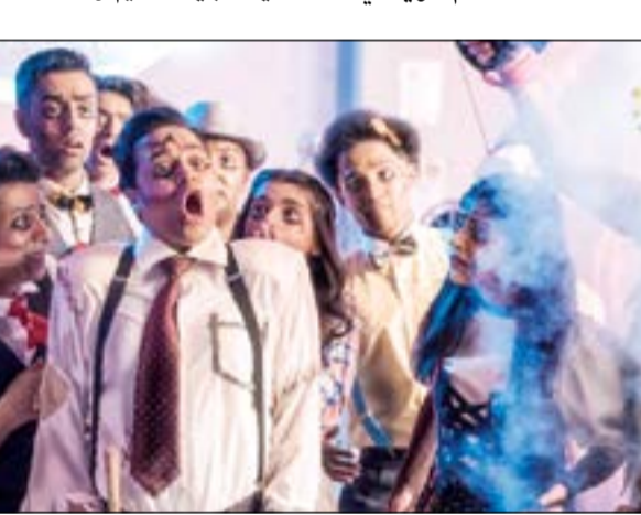
من لوحات المسرحية

الاعلانات قد احضرا من الخارج اربع العصابة «ويندي» ممزقة لتبذل الاتهامات بين الاعلانات السلمية والممزقة التي تتضح الحقيقة في النهاية بان هؤلاء الاربعة ضحايا حرب، حيث كانوا لاجئين ومشردين وأيامهم كلها شقاء.