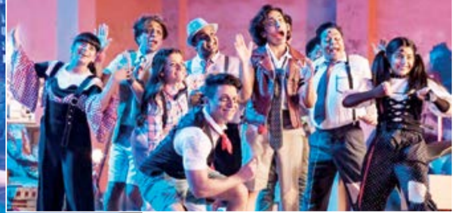
استعراضات «ويندي» جذبت الأطفال