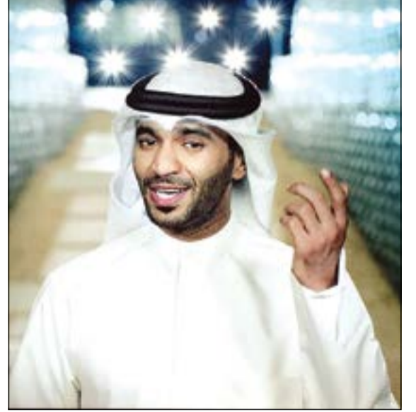
الفنان المطرف المطرف