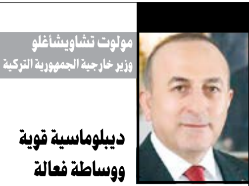
مولوت تشاوشاوغلو وزير خارجية الجمهورية التركية