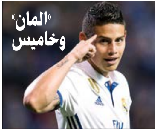
الكولومبي هدفًا لورينيو

وتجمع عدد كبير من المشجعين خارج ستاد ارتيميو فرانكي التابع لفيورنتينا ووجهوا رسالة إلى العائلة المالكة على بافظة كبيرة وضعوها على واجهة المبنى كتب عليها «ديلا فالي ارحلوا».