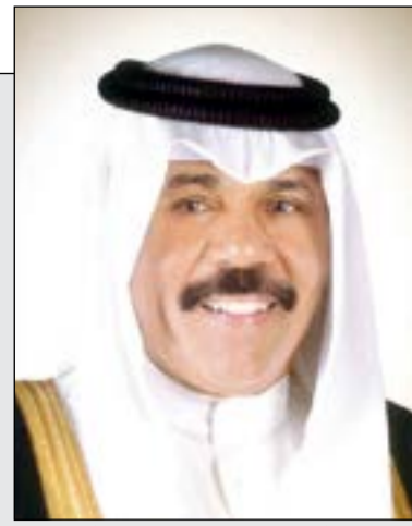
سمو نائب الأمير وولي العهد الشيخ نواف الأحمد