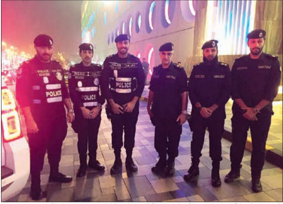
وكيل وزارة الداخلية المساعد لشؤون الأمن العام بالإنابة اللواء إبراهيم الطراح مع عدد من رجال الأمن