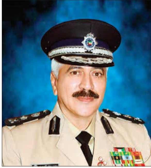
الفريق محمود الدوسري