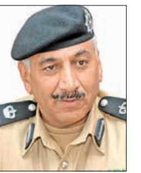
اللواء فهد الشويح

مخالفات جسيمة، هذا إلى جانب تحرير 27 ألف مخالفة، فيما بلغ عدد السيارات التي احيلت إلى كراج الحجز 224 مركبة. وقال مصدر امني ان ادارة العمليات حرت 3692 مخالفة واحالت 36 مخالفا إلى النظارة ووافقت مطلوبا و4 أحداث وحجزت 98 مركبة، وفي العاصمة تم تحرير 5849 مخالفة واحالوا إلى كراج الحجز 35 مركبة. وفي جولي تم تحرير 5565 مخالفة واحالة 23 مركبة إلى كراج الحجز