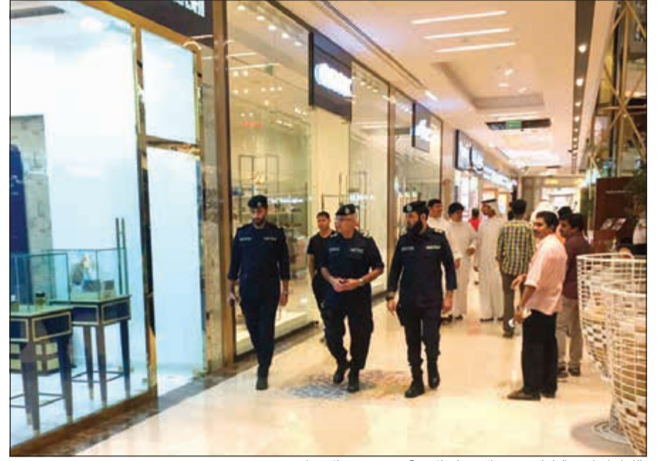
اللواء إبراهيم الطراح يتفقد الأوضاع الأمنية في عدد من الأسواق

الفطر السعيد إلى رجال الأمن العام، مشيدا بتواجدهم على رأس عملهم بعيدا عن أهلهم وذويهم. وأعرب عن سعاده لما شاهده من تواجدهم وجاهزية وانتشار وتواجد أخوانه بين المحتفين بعيد الفطر المبارك لبث الأمن والأمان والحد من أي تجاوزات أو معاكسات يمكن أن تصدر عن مشاغبين.