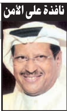
ناندة على الأمن

طلبت اسنادا وحضرت دورية الا ان المواطن رفض الامتثال للتعليمات واصطدم مجددا بالدورية الأخرى هذا، وأحضرت أطراف القضية تقارير طبية تشير الى وقوع مشاجرة عنيفة بينهم.