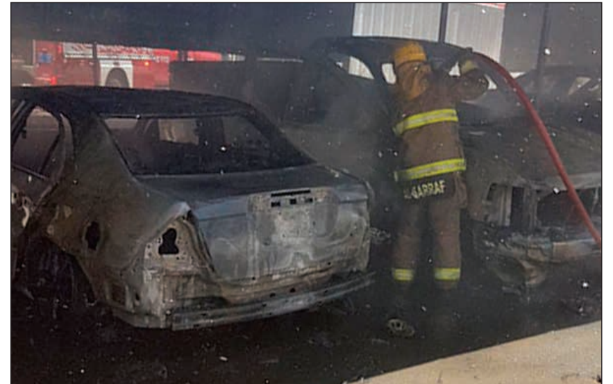
رجال الإطفاء يحاولون إخماد النيران

أمني ان الدورية تتبع مخفر شرطة العمرية وانها كانت بقيادة وكيل عريف، هذا وتعامل مع الحريق مركز اطفاء الفروانية، فيما تسبب الحريق في تعطيل حركة السير لبعض الوقت على طريق الدائري الخامس. من جهة أخرى، شرعت وحدة التحقيق في الإدارة العامة في معرفة الأسباب