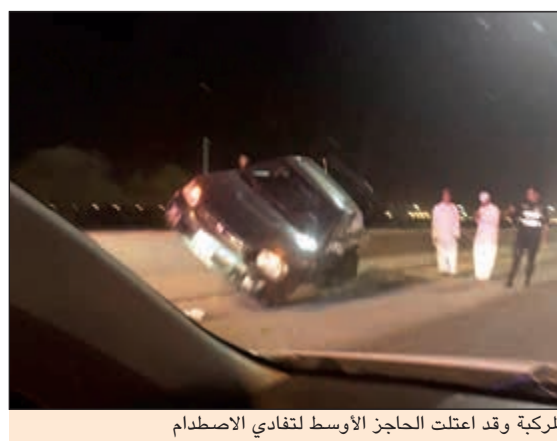
المركبة وقد اعتلت الحاجز الأوسط لتفادي الاصطدام

من قبل الطبيب وقالت انها راجعت مستشفى حكومياً وشرحت للأطباء ما حدث لها فتم ابلاغها بان الالام نتجت عن التشخيص الخاطئ.