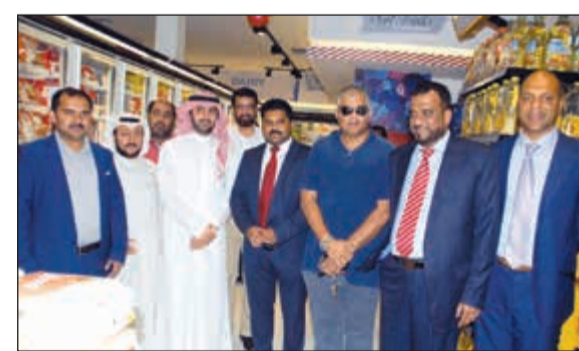
جانب من الحضور خلال الافتتاح

وقال ان من طموحات الهايبر ان يكون متاحا طوال اليوم وعلى مدار 24 ساعة وسنحاول ان نصل الى هذا الامر خلال الفترة المقبلة لكي نكون متاحين دائما وأبدا.