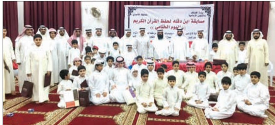
لحظة تذكارية مع الفائزين بمسابقة ابن دقله الأولى لحفظ القرآن الكريم