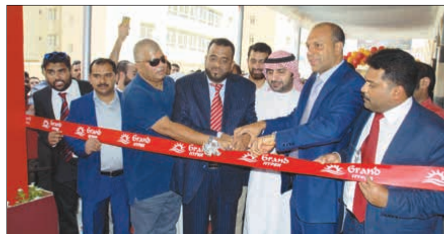
قص شريط الافتتاح

وسط أجواء احتفالية مميزة افتتحت إدارة جراند هايبر فرعها الـ45 في منطقة المهبولة وسط حضور حشد من العملاء والاعلاميين والعديد من المهتمين وقيادات الشركة. وتوافد العملاء قبل افتتاح الفرع الجديد لجراند هايبر بوقت طويل انتظارا للإعلان الرسمي عن افتتاح الفرع الجديد والاستفادة من العروض المميزة والأسعار المثالية التي قدمتها الشركة بمناسبة الفرع الجديد.