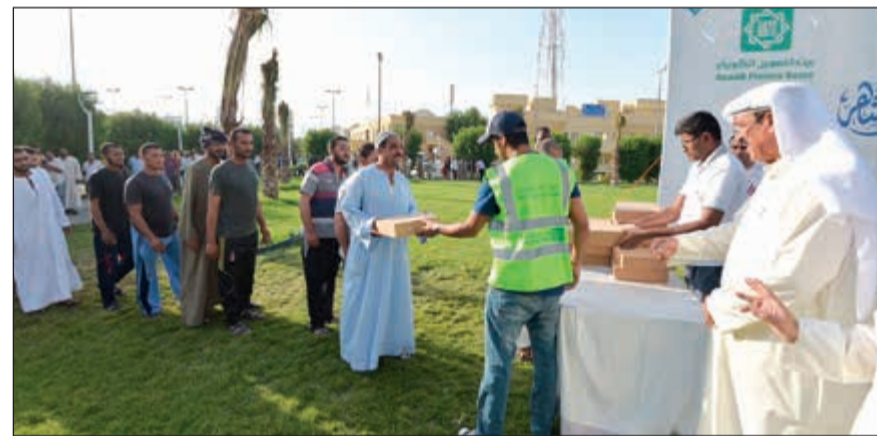
جانب من توزيع وجبات الإفطار

الرمضاني أنشطة ومساهمات توعوية وإنسانية واجتماعية متعددة، تؤكد حرص البنك الاجتماعي، ويهدف إلى دعم جميع مبادرات العمل التطوعي والإنساني.