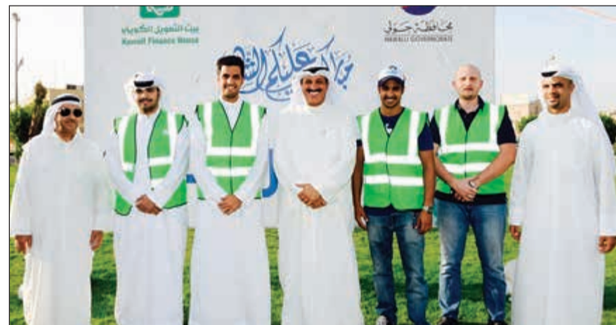
فريق متطوعي بيتك في حديقة حولي