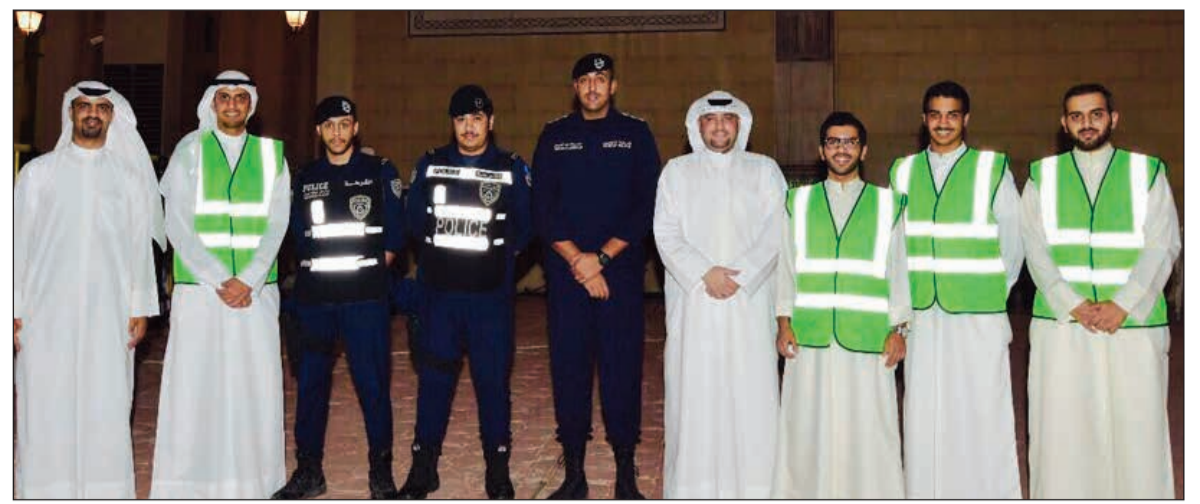
فريق «بيتك» مع رجال الأمن في المسجد الكبير

كشفت أديداس عن إصدارات Parley الجديدة المتوفرة لأحذية UltraBOOST و UltraBOOST X و Uncaged بلون أزرق مستوحى من تواجدها مياه المحيطات، وتعمل أديداس اليوم على تحويل المخلفات البلاستيكية الخطيرة في البحار إلى خيوط تدخل في تصميم أحذية الجري المتميزة بقوة أدائها، ويعكس هذا الإنجاز التزام الطرفين بالحفاظ على مياه المحيطات من خلال العمل معا لتنفيذ استراتيجية Parley A.I.R التي تدعو إلى تجنب استخدام البلاستيك الخام ووضع حد للمخلفات البلاستيكية وإعادة تصميم