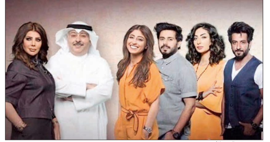
فريق عمل «اليوم الأسود»

«اليوم الأسود» أفضل مسلسلات الموسم .. و«رمانة» الأفضل كوميديا 25