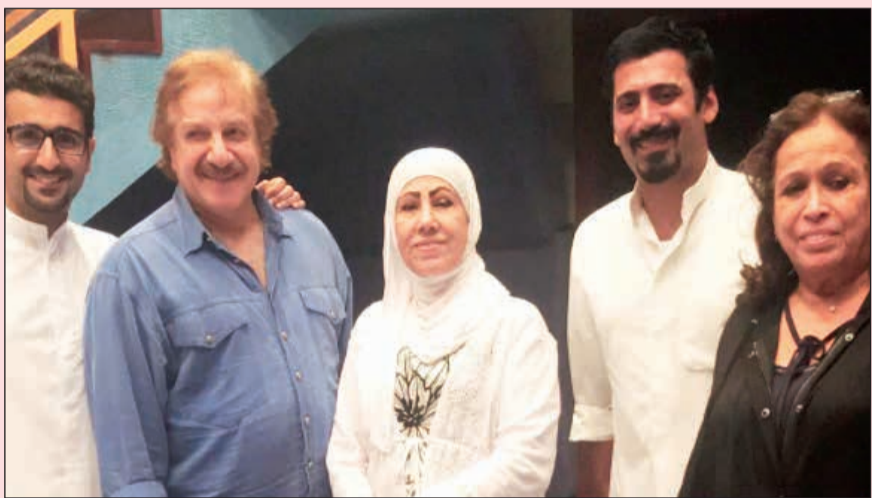
.. ومع نجوم المسلسل الإذاعي «غنيمة وغنايم»

في موقف صعب وأنتظر الموافقة على «أمانى العمر»