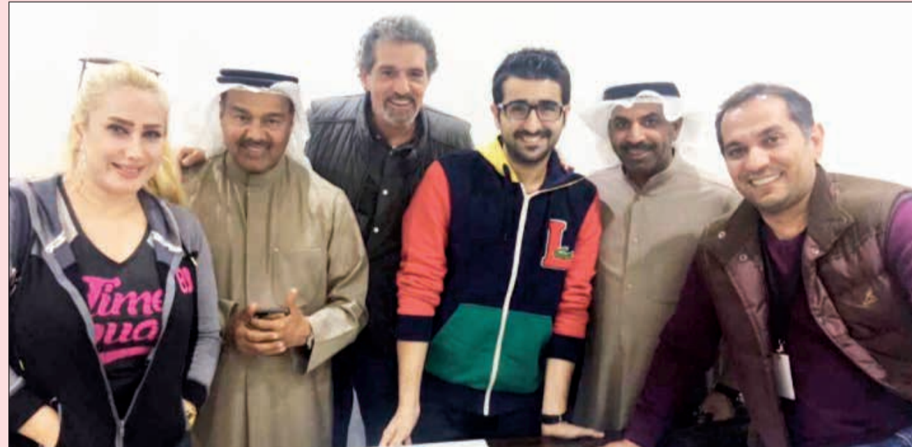
محمد الكندري يتوسط المخرج نعمان حسين ونجوم «بوطبيع» ومعهم النجم طارق العلي