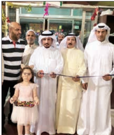
جانب من الافتتاح