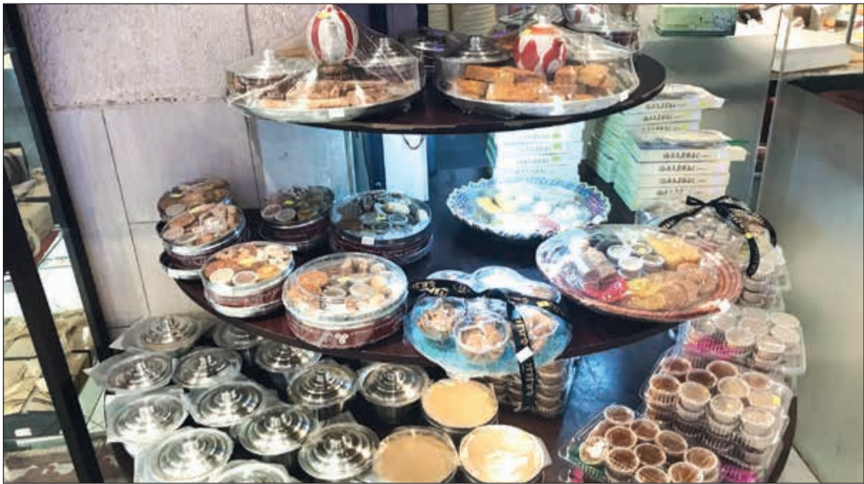
حلويات عربية وخليجية استعادوا للعيد