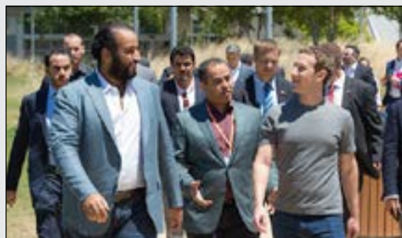
الأمير محمد بن سلمان مع الرئيس التنفيذي لـ «فيسبوك» مارك زوكربيرغ

العربية نت: منذ تقلد صاحب السمو الملكي الأمير محمد بن سلمان بن عبدالعزيز مناصب عليا في الحكومة السعودية لم يهدأ في عاصفة من العمل والزيارات والشراكات وبناء الاقتصاد ولقاء رؤساء الدول وقادة الدفاع وأساطين الاقتصاد وملك الكيانات الاقتصادية. وبدأ صاحب السمو الملكي الأمير محمد بن سلمان بن عبدالعزيز كوزير للدفاع بأول عملية له في الانطلاق بعاصفة الحزم التي تشهد تأمين الحدود الجنوبية للسعودية من تعرض ميليشيات الحوثي المدعومة من إيران. ولم يغفل الأمير محمد بن سلمان بناء التحالفات مع العرب والعربية والإسلامية والصديقة في سبيل إبقاء مصالح المملكة وحدودها الإقليمية في مأمن من كل الأحداث المحيطة بها.