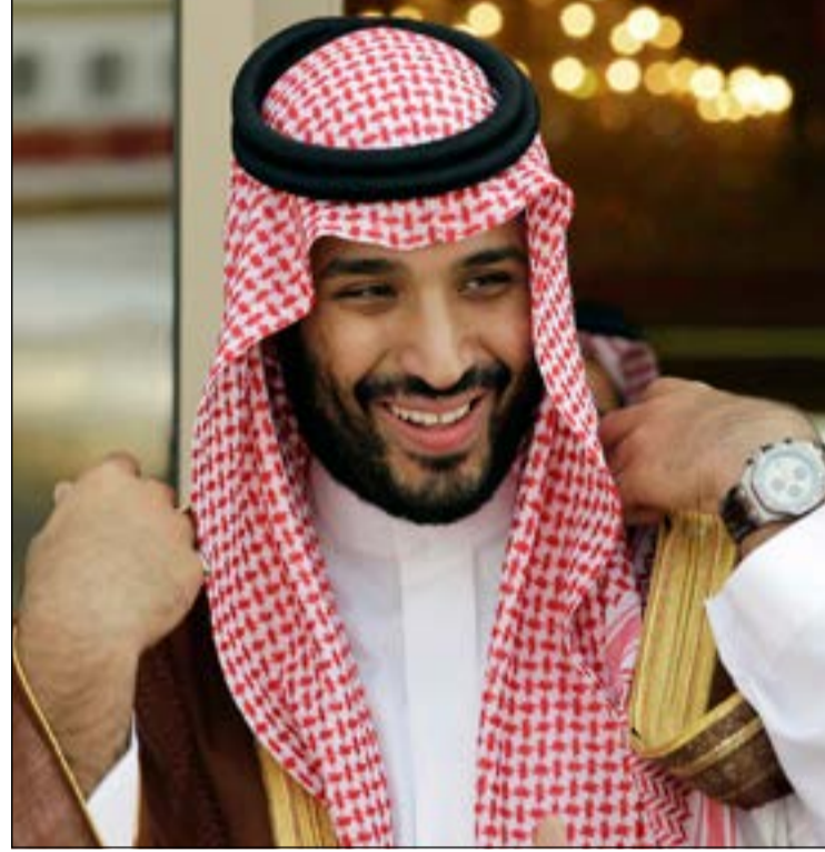
صاحب السمو الملكي الأمير محمد بن سلمان ولي العهد نائب رئيس مجلس الوزراء وزير الدفاع