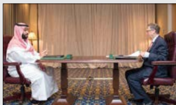
مع إحدى الشخصيات الأممية