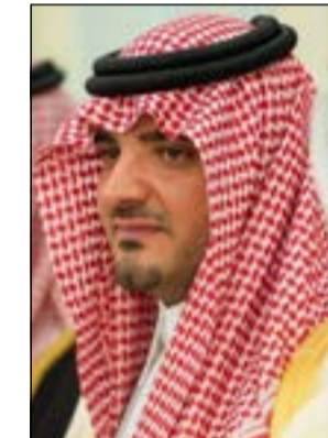
وزير الداخلية الأمير عبد العزيز بن سعود

الرياض - واس: أصدر خادم الحرمين الشريفين الملك سلمان بن عبدالعزيز أمراً ملكياً أمس، قضى بإعفاء صاحب السمو الملكي الأمير محمد بن نايف من منصبه ولياً للعهد. وقضى الأمر الملكي بتعيين صاحب السمو الملكي الأمير محمد بن سلمان بن عبدالعزيز ولياً للعهد، وتعيينه نائباً لرئيس مجلس الوزراء مع استمراره وزيراً للدفاع، بحسب الأوامر الملكية التي أوردتها وكالة الأنباء السعودية «واس». وجاء في الأمر الملكي «أولاً: يعفى صاحب السمو الملكي الأمير محمد بن نايف بن عبدالعزيز آل سعود من ولاية العهد، ومن منصب نائب رئيس مجلس الوزراء ومنصب وزير الداخلية. ثانياً: اختيار صاحب السمو الملكي الأمير محمد بن سلمان بن عبدالعزيز آل سعود ولياً للعهد، وتعيين سموه نائباً لرئيس مجلس الوزراء مع استمراره وزيراً للدفاع، واستمراره فيما كلف به من مهام أخرى». وأضاف الأمر الملكي أن القرار جاء «بناءً على ما طلع عليه أعضاء هيئة البيعة من