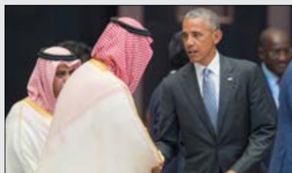
الأمير محمد بن سلمان مع الرئيس الأميركي السابق باراك أوباما