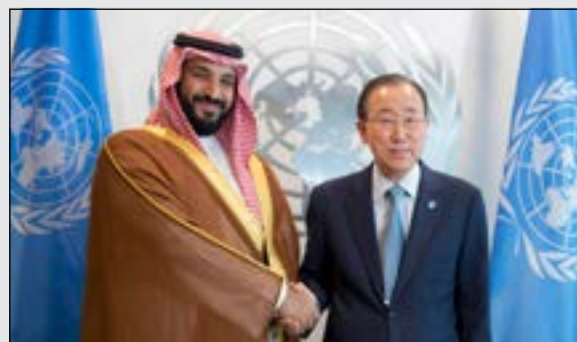
الأمير محمد بن سلمان مع بان كي مون الأمين العام السابق للأمم المتحدة