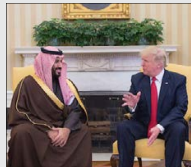
صاحب السمو الملكي الأمير محمد بن سلمان مع الرئيس الأميركي دونالد ترامب