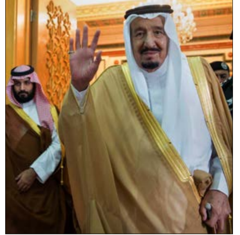
خادم الحرمين الشريفين الملك سلمان بن عبدالعزيز