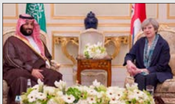
الأمير محمد بن سلمان مع رئيسة الوزراء البريطانية تيريزا ماي