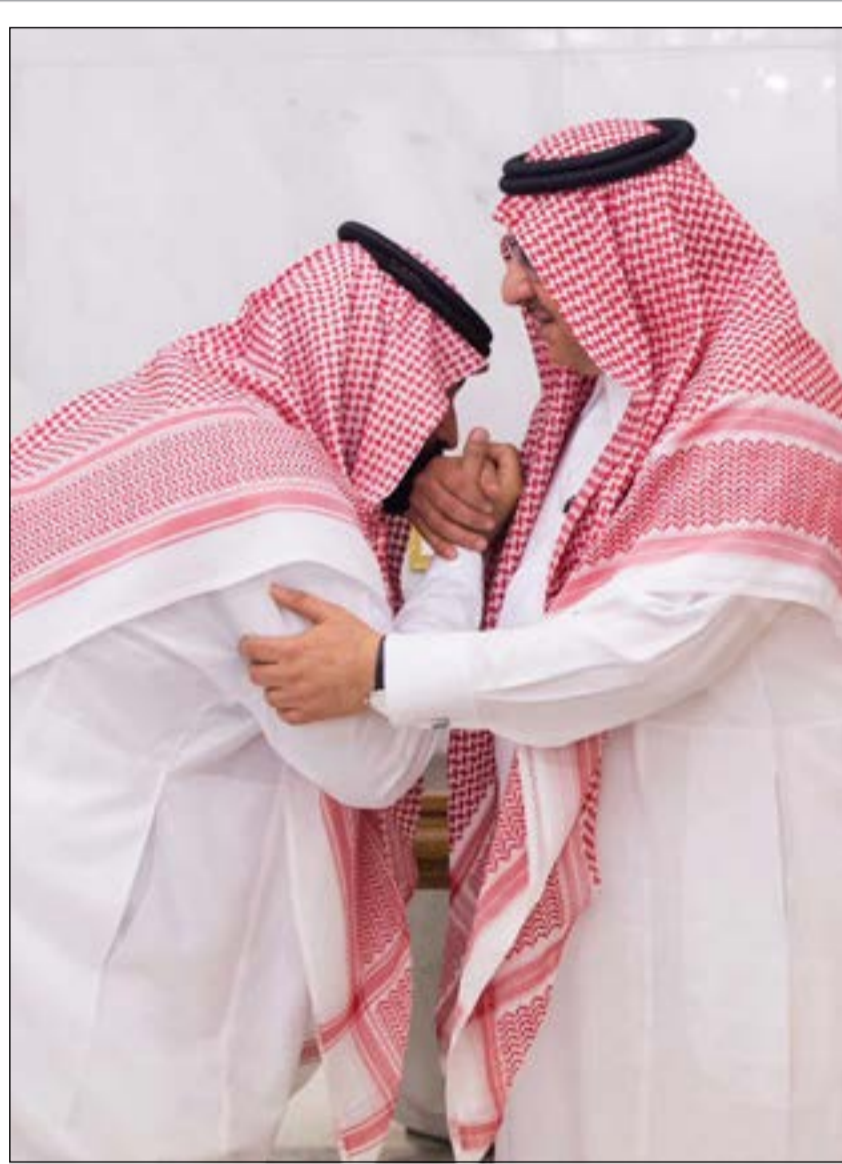
صاحب السمو الملكي الأمير محمد بن نايف مبايعاً ولي العهد الجديد صاحب السمو الملكي الأمير محمد بن سلمان