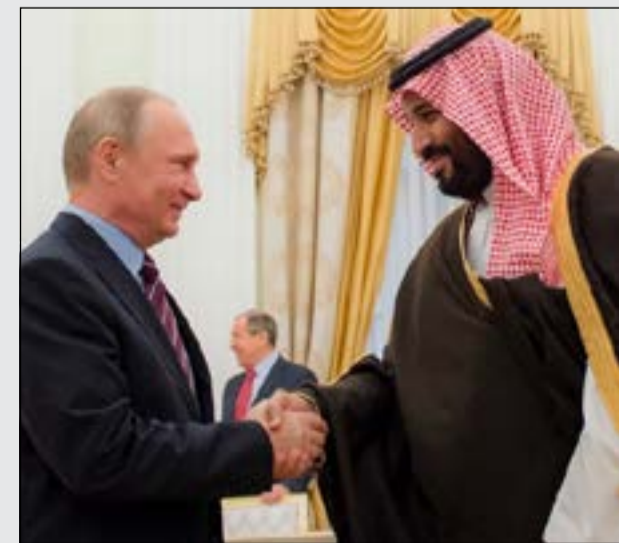
مع الرئيس الروسي فلاديمير بوتين

الزيارات السياسية تحرك محمد بن سلمان خلال 1000 يوم إلى أكثر من 70 زيارة في كل أرجاء الأرض في زيارات مجدولة، فغارة للصين واليابان وروسيا، وتارة لأميركا، وتارة يرتب زيارات لوفود رسمية للرياض والالتقاء بها. وتعد القمم الثلاث التي عقدت في الرياض أحد الأعمال التي يقف خلفها الأمير محمد بن سلمان، حيث عقدت قمة سعودية أميركية، وأخرى خليجية أميركية، وثالثة عربية إسلامية أميركية، بحضور عدد من الرؤساء من مختلف دول العالم بحضور الرئيس الأميركي دونالد ترامب.