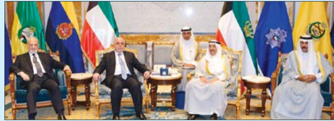
صاحب السمو الأمير الشيخ صباح الأحمد وسمو ولي العهد الشيخ نواف الأحمد خلال استقبال دحيد العبادي ودايراهيم الجعفري

مباحثات كويتية - عراقية حول العلاقات الثنائية والمستجدات الراهنة