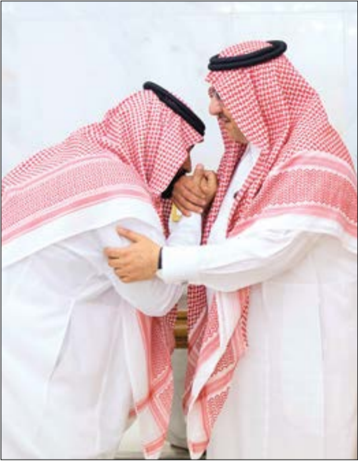
صاحب السمو الملكي الأمير محمد بن نايف يبايع صاحب السمو الملكي الأمير محمد بن سلمان ولياً للعهد

عبد العزيز بن سعود بن نايف وزيراً للداخلية.. وإعادة جميع البدلات لموظفي الدولة