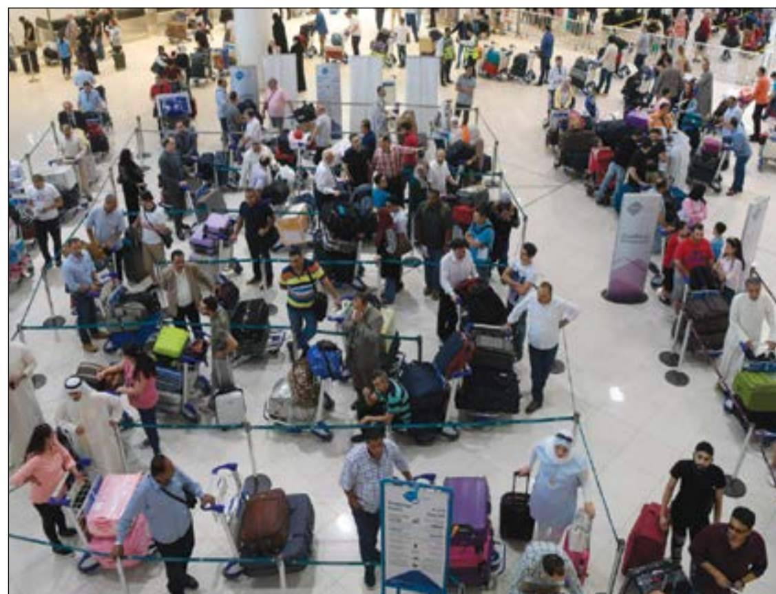
ازدحام في صالة المغادرين قبيل قدوم عيد الفطر (محمد هاشم)

الفوزان أن نحو 40 ألفاً من المواطنين والمقيمين سيغادرون العطلة خارج الكويت، فيما يزيد عدد من سيغادرون اجازة العطلة الصيفية بالخارج على 280 ألف مسافر. حالة الاستنفار ساعدت فرج ناصر وسط حالة من التأهب والاستعداد في مطار الكويت والذي اكتظ بألاف المغادرين لقضاء عطلة العيد، أكد مدير إدارة الطيران المدني يوسف