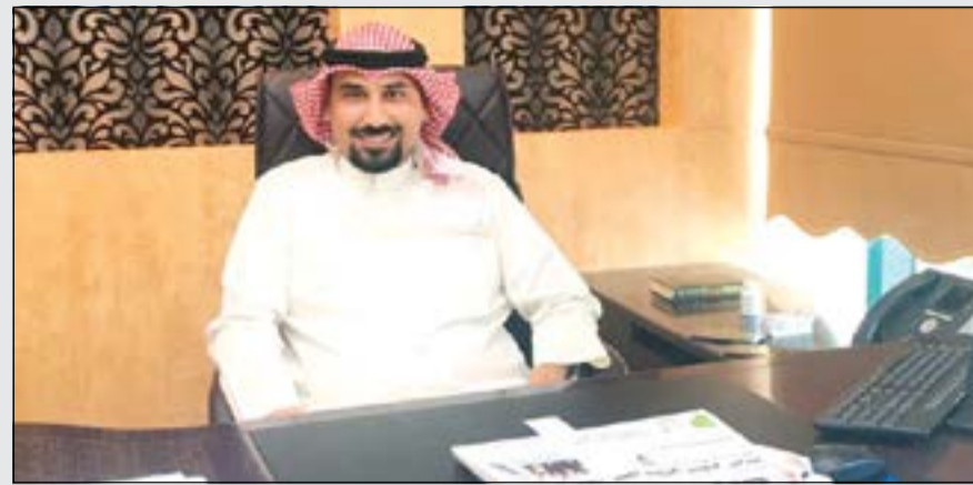
الشيخ صباح سلمان داود الصباح