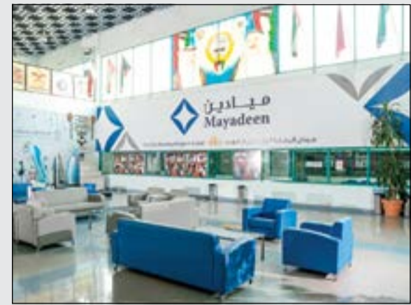
خطة إصلاحية في ميادين

هل تخططون لنقل تجربة الميادين إلى خارج الكويت؟