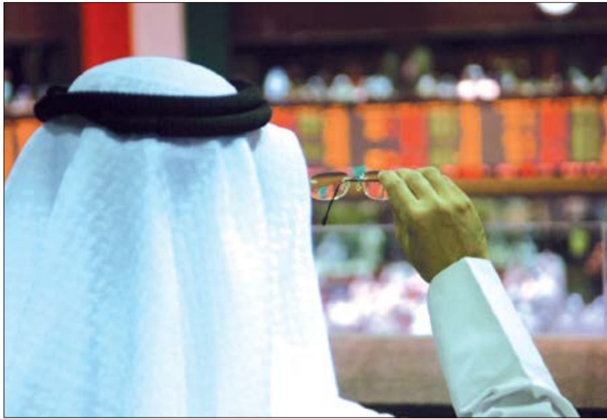
زيادة ملحوظة في نشاط المطلعين بالبورصة خلال تداولات مايو الماضي

الماضي، حيث تمت 12 عملية شراء وبيع بقيمة إجمالية 665 ألف دينار، ولوحظ أن عمليات الشراء كانت أكبر بـ 10 عمليات بقيمة 215 ألف دينار، ورغم اقتصر عمليات البيع على عمليتين فقط إلا أن القيمة كانت 450 ألف دينار تشكل