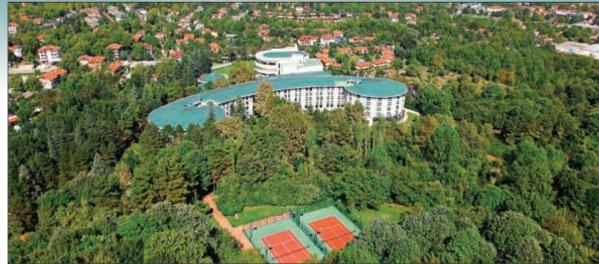
منتجع إن جي سابانجا