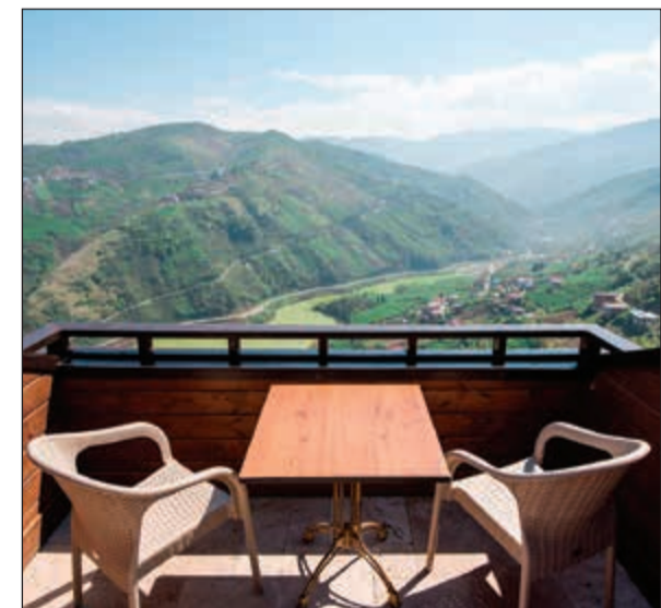
سيراليك... من منتجع ريف طرابزون

وعن جديد السياحة التركية وبرز ما تقدمه مجموعة بدر للسياحة لعملائها، بين كرك أن «بدر للسياحة» اسم عريق في عالم السياحة، وهي عالمية بامتياز وأغلبية أنشطتها السياحية في الشرق الأوسط من جنوب أفريقيا إلى شمالها، إضافة إلى السوق العربي وإيران وتركيا بمختلف مدنها الجاذبة للسياحة، مضيفا أن نظام الحجوزات الإلكتروني «بادير أون لاين» شامل حجوزات الفنادق والتذاكر والرحلات وتأجير السيارات، وهو مخصص للشركات السياحية وتنظيم الرحلات الجماعية في تركيا، في حين سيغطي خلال الأشهر القادمة الكرة الأرضية، كما سيتضمن الموصلات الداخلية، والرحلات السياحية، وهذا إنجاز مهم للغاية، مشيرا إلى أن مجموعة بدر تساهم إلى جانب الحكومة التركية وباقي وكالات السياحة في عملية تنشيط السياحة والترويج للمناطق المختلفة، فنحن نشترك في ورش عمل دولية، ونشارك دائما في المعارض السياحية حول العالم مثل دبليو تي أم في لندن، وأي تي بي في برلين والملتقى في دبي، كما نقوم بتنظيم رحلات للشركات والإعلاميين إلى مختلف مناطق تركيا الرائعة لكي يطعموا عن قرب على الخدمات والفنادق والمقومات السياحية التي تمتلكها تلك المناطق الرائعة ذات المناظر