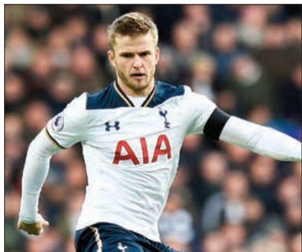
نجم وسط السبيرز

يرغب مان يونايته بقيادة مدربه البرتغالي جوزيه مورينيو في التعاقد مع لاعب وسط توتنهام إيريك داير.