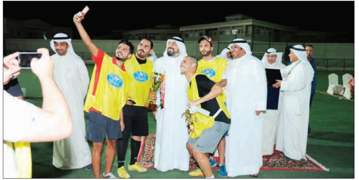
«سليفي» مع الشيخ د.طلال الفهد والفريق البطل

وقيمها النبيلة المتمثلة باستذكار شهدائنا البررة في بيت القرين وتضحياتهم بدمائهم الزكية فضرخوا بوقفتهم البطولية أروع الأمثلة في تعاضد وتلاحم أبناء الشعب الواحد. وعبر السبيعي عن سعادته بظهور الدورة بهذا الشكل الرائع والمشرف، مؤكداً مواصلة دعمه للدورة في المواسم المقبلة لما تحمل من مضامين هادفة وكونها تعد من قبيل الواجب تجاه شهداء الكويت الأبرار.