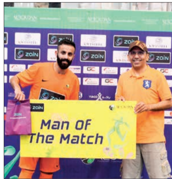
تكريم أفضل لاعب في إحدى المباريات