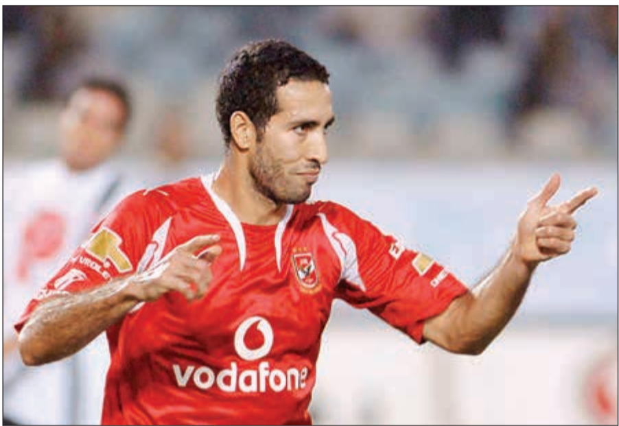
محمد أبوتريكة أشهر من نار على علم في الوطن العربي