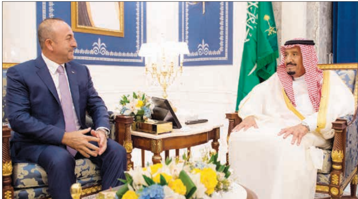
خادم الحرمين الملك سلمان بن عبد العزيز مستقبلاً وزير الخارجية التركي مولود جاويش أوغلو

الرياض - وكالات: أصدر خادم الحرمين الشريفين الملك سلمان بن عبدالعزيز صباح أمس، عدة أوامر ملكية، من بينها تحويل هيئة التحقيق والإدعاء العام إلى «النيابة العامة»، وتبعتها للملك مباشرة، وضمان استقلاليتها تماشياً مع القواعد المتبعة في معظم دول العالم، وتحقيقاً لمبدأ الفصل بين السلطات، بحسب ما أوردت وكالة الأنباء السعودية «واس». هذا ونص الأمر الملكي الخاص بـ «النيابة العامة» على تبعتها للملك مباشرة واستقلاليتها الكاملة، ومنع التدخل في أعمالها، وتكليف هيئة الخبراء على مجلس الوزراء بمراجعة نظام «هيئة التحقيق والإدعاء العام»، واقتراح تعديل ما يلزم منها خلال فترة لا تتجاوز 90 يوماً. وشملت القرارات إعفاء الشيخ محمد بن فهد بن