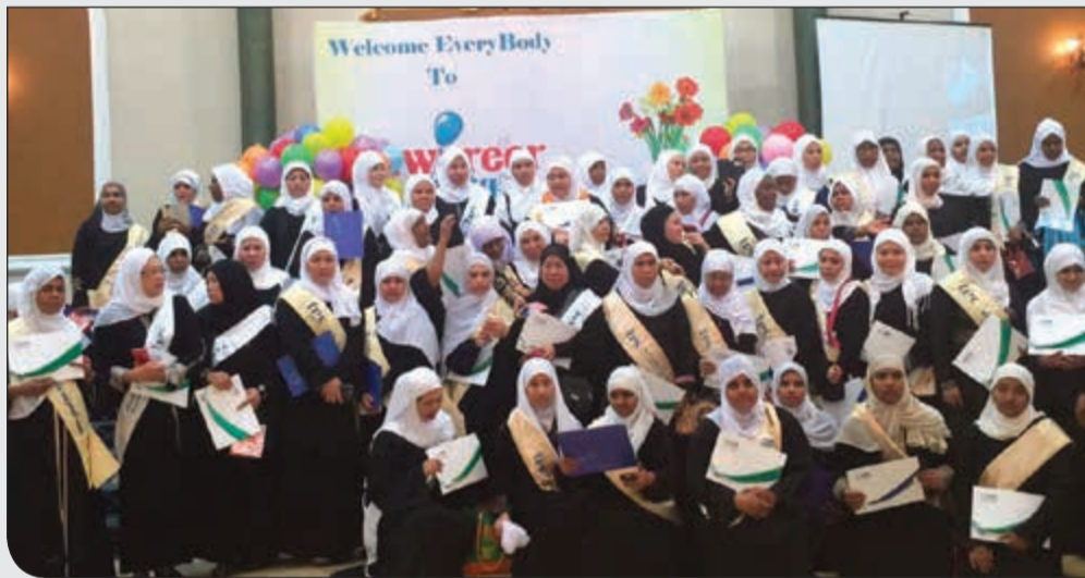
رعاية المهديات من اولويات اللجنة

الدعوية، وكذلك تكثيف الجهود لرعاية المهديات وتاهيلهن ومتابعة الفصول الدراسية وتنظيمها، والتعرف على المناهج الدعوية المتطورة، وخدمة اهالي منطقة السالمية، ولله الحمد والمنة، فرع السالمية النسائي رغم حداثة إلا أنه حقق انجازات دعوية مميزة. والهداية بيد الخالق جل و علا، فقط نحن نقدم ما لدينا من بضاعة نفسية للطرف الآخر ونحرص على عرضها بأساليب تالقي اعجابهم واهتمامهم، وبفضل الله يشهر إسلامه يوميا بالكويت عدد لا بأس به من الجاليات الوافدة، في شتى أفرع اللجنة المنتشرة من الجهراء إلى الوفرة، وبعد الأشهر تقوم اللجنة بجهود حفيظة لدعم هذا المهدي ومساندته في مرحلة إسلامه وتعريفه أكثر بالدين الجديد الذي اعتنقه من خلال الدورات الشرعية واللقاءات الثقافية والزيارات ورحلات العمرة وغيرها من الأنشطة.