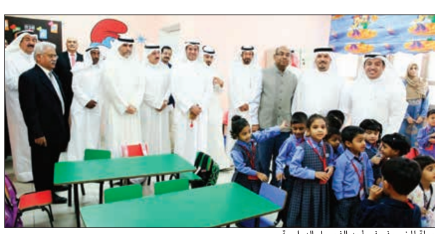
جولة للضيوف في أحد الفصول الدراسية