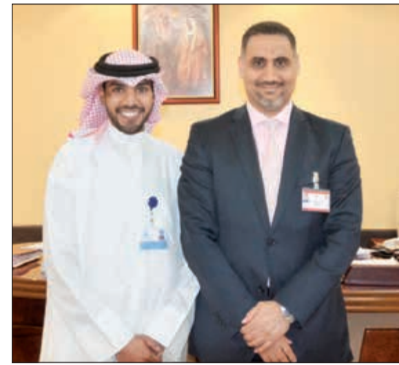
جانب من زيارة المستشفى

على دعم ورعاية الكثير من البرامج والفعاليات المجتمعية الهادفة لتطوير القطاعات الحيوية ومنها قطاع الخدمات الصحية. ويؤمن بنك الكويت الدولي بأن دوره أبعد من مجرد توفير الخدمات والمنتجات المصرفية، بل أنه مسؤول عن تبني العديد من المبادرات الإنسانية والاجتماعية الهادفة لخدمة المجتمع وتلبية احتياجات أفراد في مختلف القطاعات. كما يحرص الدولي على تقديم رعايته لضمان توفير طوال العام للعديد من المؤسسات والمبادرات الصحية، إلى جانب تركيزه على رفع مستوى الوعي الصحي تجاه القضايا الصحية الرئيسية التي تؤثر على المجتمع الكويتي.