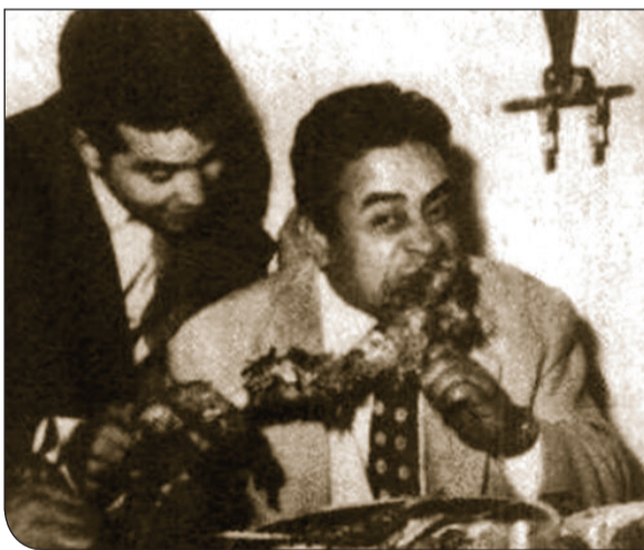
إفطار إحسان عبد القدوس