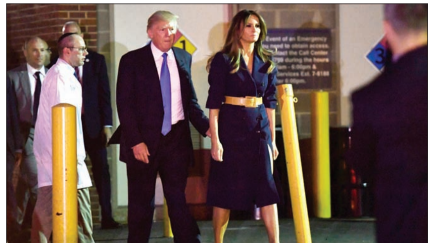
ترامب وزوجته ميلانيا خلال زيارة مستشفى ميمستار للاطمئنان على النائب الجمهوري ستيف سكاليس

عواصم - وكالات: وافق مجلس الشيوخ الأمريكي بالأغلبية الكاسحة على فرض عقوبات جديدة ضد روسيا على خلفية اتهامها بالتدخل في الانتخابات الرئاسية العام الماضي مع إلزام الرئيس دونالد ترامب بالحصول على موافقة الكونغرس قبل أي تخفيف للعقوبات الحالية.