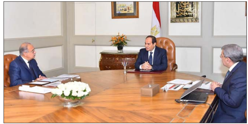
الرئيس عبد الفتاح السيسي مجتمعاً برئيس الوزراء المتابعة الأداء الاقتصادي (رئاسة الجمهورية)

وأضاف أن تلك الإجراءات تاتي وفقا لنص المادة 151