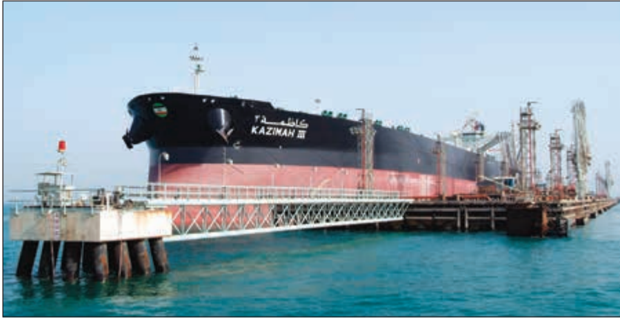
«ناقلات النفط» تتوسع في صيانة ناقلاتها مع شركة «أسري»