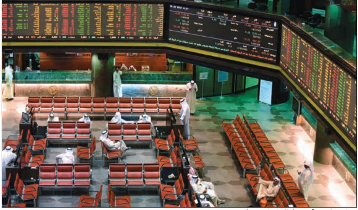
ارتياح في البورصة بعد قرار الإبقاء على سعر الخصم

انعكس قرار بنك الكويت المركزي مساء أول من أمس، الإبقاء على سعر الخصم دون تغيير عند 2,75٪، على أداء مؤشرات بورصة الكويت بشكل إيجابي في جلسة أمس، حيث أنهت البورصة تعاملاتها على ارتفاع جماعي للمؤشرات بنسبة 0,3٪ للمؤشرات الوزنية، وب 0,5٪ للمؤشر السعري، فضلا عن زيادة في حجم السيولة بنسبة 50٪ مقارنة بجلسة أول من أمس ببلغها 9,5 ملايين دينار. وجاء قرار المركزي الكويتي عقب رفع مجلس الاحتياطي الاتحادي الأمريكي أسعار الفائدة بمقدار 25 نقطة أساس، وذلك لأسباب تتعلق بانخفاض أسعار النفط ودعم النمو الاقتصادي.