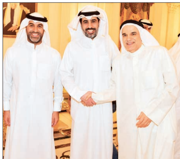
علي الخميس مهنتا