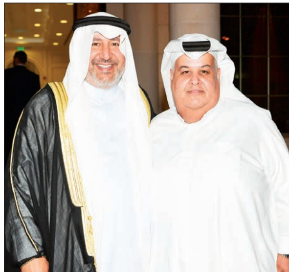
الشيخ فهد الجابر يبارك