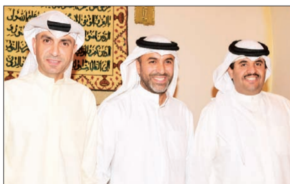
الشيخ دموع الخليفة يبارك