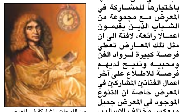
من لوحات المعرض

وسط حضور نخبة كبيرة من فنانين الفن التشكيلي ومحبيه ومتابعيه وفي أجواء رمضانية ساحرة، افتتح مساء أول امس معرض «the gallery» بمجمع الحمراء والذي يمتد لاسبوعين.