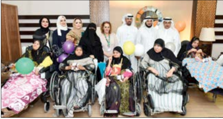
لقطة تذكارية خلال الزيارة