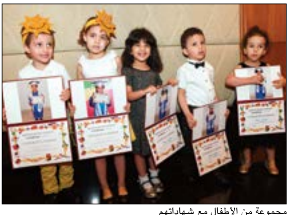
مجموعة من الأطفال مع شهادتهم