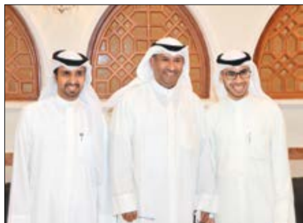
الإعلامي طلال الياقوت مباركا