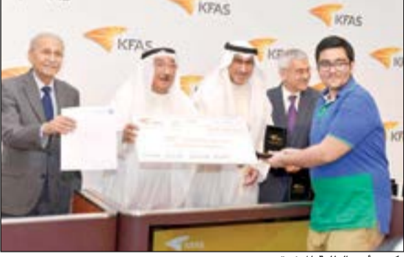
تكريم أحد الطلبة المتفوقين