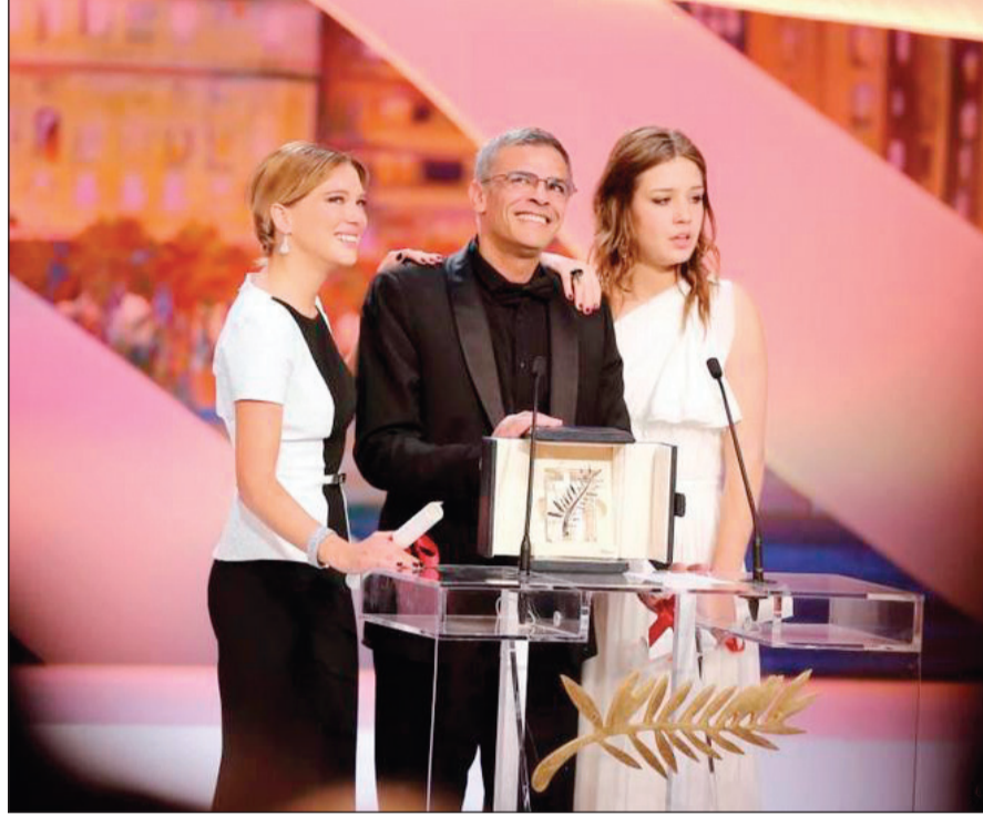
المخرج عبد اللطيف كشيش

قرر المخرج الفرنسي من أصل تونسي عبد اللطيف كشيش بيع السعة الذهبية التي فاز بها عام 2013 بمهرجان كان السينمائي عن فيلمه «حياة أدبل» في المزاد.