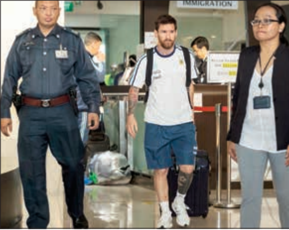
ليو يعود الى برشلونة من اجل عقده الجديد

قالت صحيفة «سبورت» الإسبانية إن عودة الأرجنتيني ليونيل ميسي إلى برشلونة من المرجح أن تكون لإعلان النادي الكاتالوني تمديد عقد لاعبه الذي ينتهي في صيف عام 2018، حيث سيتم إضفاء الطابع الرسمي على تمديد التعاقد حتى 2021. وكانت تقارير صحافية قد ذكرت سابقاً أن البارسا سيحدد عقد البرغوث إلى عام 2021 على أن يصبح الشرط الجزائي في عقد اللاعب 400 مليون يورو بعدما كان 250 مليوناً فقط.