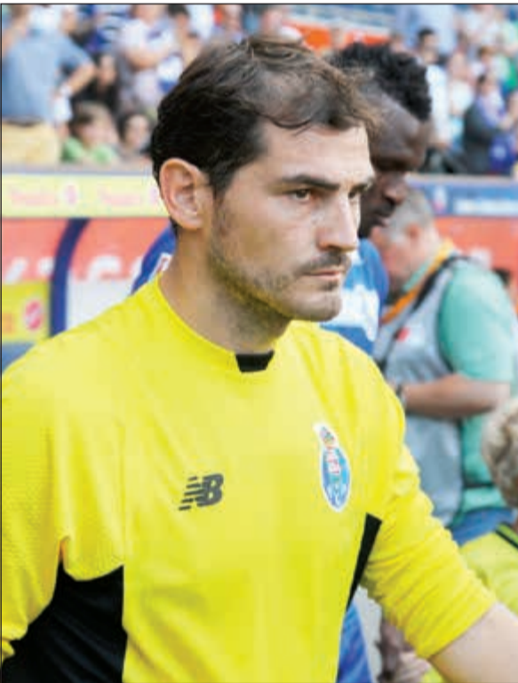
كاسياس والتفكير في القادم

عرض الإسباني إيك كاسياس حارس مرمى بورتو البرتغالي نفسه على نابولي الإيطالي، ليتولى حراسة مرمى الفريق في ظل غموض موقف مواطنه بيبي رينا.