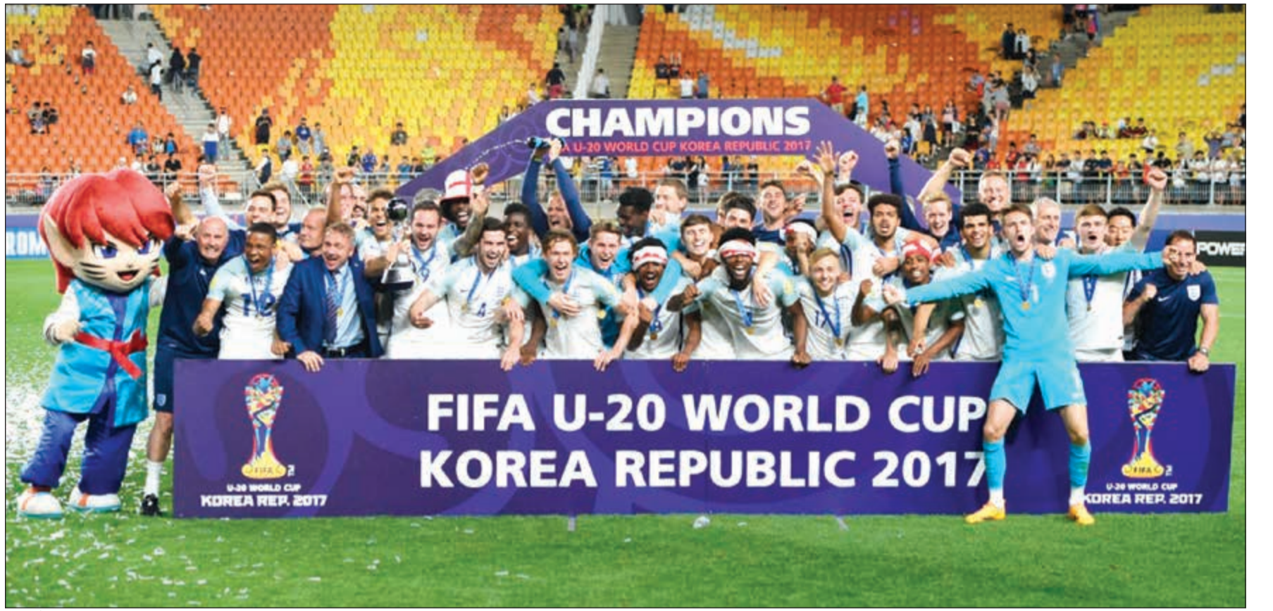
فرقة لاعبي منتخب شباب إنجلترا بالإنجاز الكبير

أعلن نادي بايرن ميونخ بطل دوري الدرجة الأولى الألماني لكرة القدم أمس أنه تعاقد مع لاعب وسط فيردير بريمن الحالي وأرسنال الإنجليزي السابق سيرج جنابري لمدة ثلاثة أعوام. وأحرز جنابري (21 عاماً) 11 هدفاً في الدوري الألماني مع فيردير بريمن في الموسم المنقضي كما تقاسم صدارة قائمة هدافي دورة الألعاب الأولمبية الصيفية الأخيرة في ريو دي جانيرو في العام الماضي عندما فازت ألمانيا بفضية كرة القدم. وانتقل جنابري إلى فيردير بريمن في بداية الموسم الحالي عقب فشله في تأمين مكان في التشكيلة الأساسية في أرسنال اللندني وبعد أن أمضى موسم 2015-2016 معاراً إلى وست بروميتش البيون.