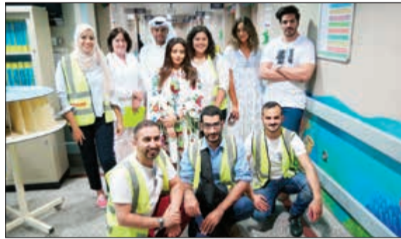
لقطة لفريق «نعين ونعاون» في مستشفى الجهراء