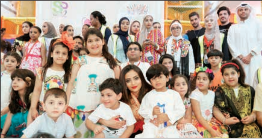
صورة جماعية بعد تجهيز القرقيعان

زارت Ooredoo، أسرع شبكة في الكويت، عددا من الأجنحة في مختلف مستشفيات الكويت للاحتفال معهم بالقرقيعان، وذلك انساقا مع سياستها للمسؤولية الاجتماعية المبنية على الاهتمام والتواصل. وقدمت الشركة للأطفال علب قرقيعان تم تجهيزها من قبل متطوعي برنامج «نعين ونعاون» التطوعي بمشاركة عدد من الأطفال وذلك ضمن فعالية Heart to Heart التطوعية التي أقيمت الخميس الماضي، وقام فريق من موظفي Ooredoo والمتطوعين بزيارة عدد من المستشفيات خلال عطلة نهاية الأسبوع لتوزيع القرقيعان على أجنحة الأطفال.