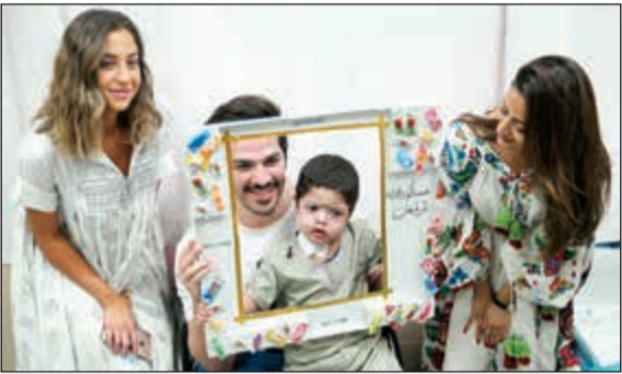
مع أحد الأطفال في مستشفى الجهراء

عمل المركز، بهدف التواصل معهم في هذا الشهر الكريم. وأكدت الشركة في بيان صحافي أن دعم العمل التطوعي تابع من قيم الشركة الأساسية المبنية على الاهتمام والتواصل والتحدى، وأن هذه المبادرات تأتي لتوطيد العلاقة مع المجتمع وتعزيز القيم الإنسانية والروحية التي تعمل على إحياء قيم التكافل التي يجسدها شهر رمضان المبارك. وكجزء من برنامجها لهذا العام، أطلقت Ooredoo بالتعاون مع منظمة Spread the Passion ومؤسسة الكويت للتقدم العلمي، بالإضافة إلى Spread the Passion التي تجمعها مع الشركة شراكة طويلة الأمد في مجال تطوير الخبرات الشبابية التطوعية، وسيتم تأهيل الشباب لإدارة البرامج والمبادرات التطوعية التي سيتم إطلاقها على مدار الشهر الفضيل.