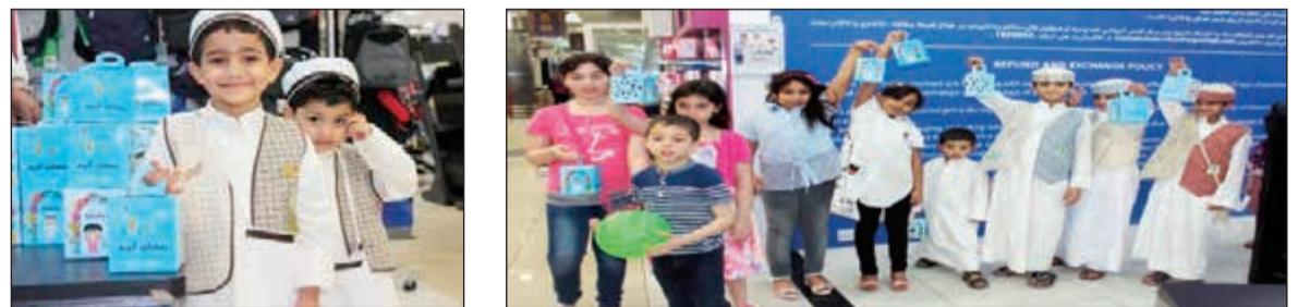
توزيع قرقيعان النصر

احتفل النصر بالقرقيعان الخاص بالأطفال والذي نظم في 5 معارض، في معرض العقيلة بجانب البيروق ومعرض الري مقابل الأقبوز ومعرض النصر بمجمع البرج الأخضر الفخيل ومعرض النصر بمجمع الناصر مول ومعرض الري مقابل الدائري الرابع من الساعة 9 حتى 12 ليلا. ويأتي هذا الحفل كجزء من تطبيقات المسؤولية الاجتماعية التي يتبناها النصر في سعيه