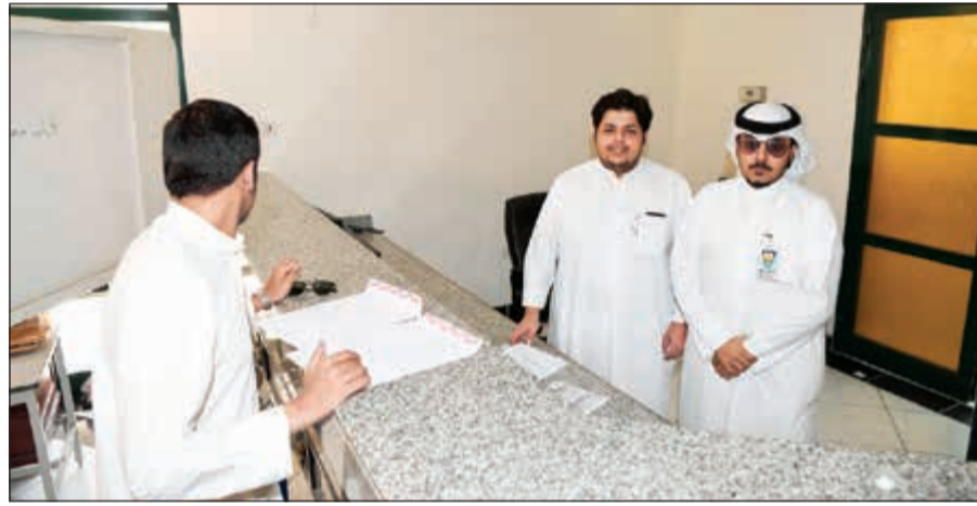
مكتب اتحاد الطلبة في صالة التسجيل