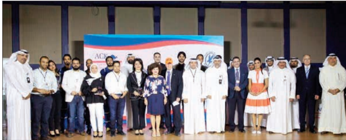
صورة جماعية من حفل التكريم

قام مركز الخريجين والإرشاد الوظيفي لدى الكلية الأسترالية في الكويت بتنظيم حفل تكريم وتوزيع الجوائز التقديرية لشركة نفط الكويت في حرم الكلية الأسترالية في الكويت.