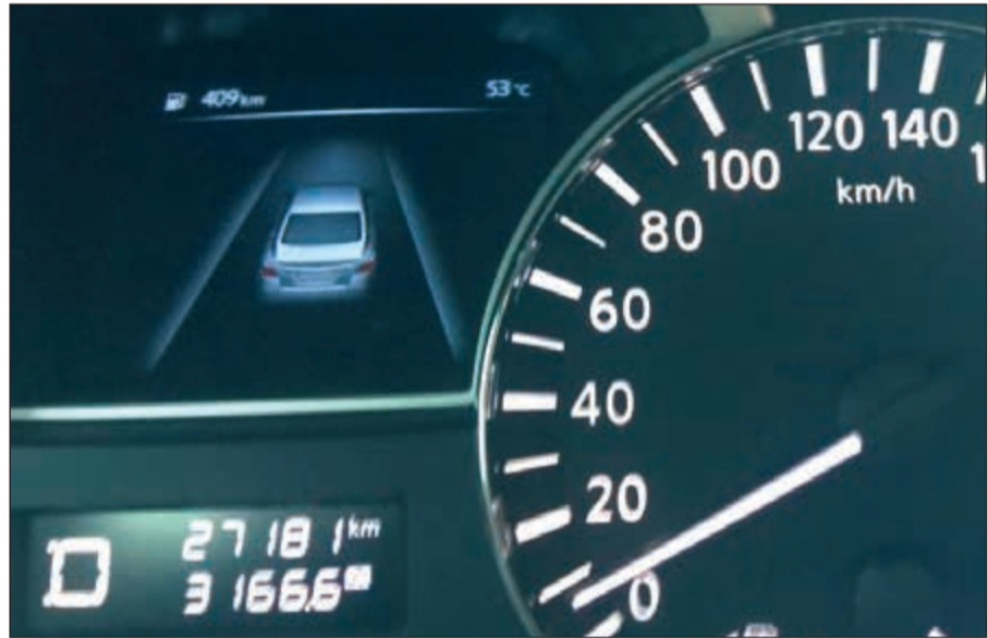
مؤشر درجة الحرارة بإحدى السيارات 53