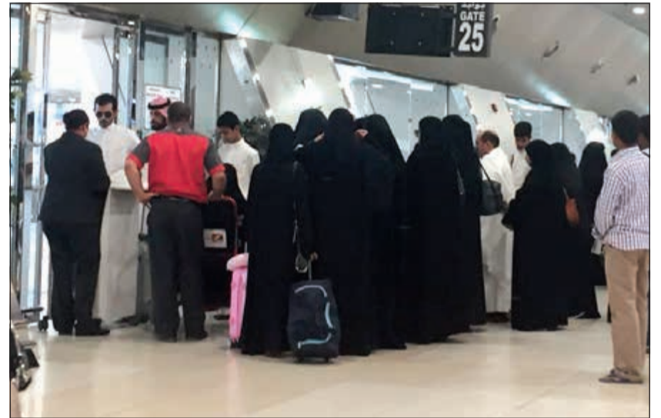
ركاب إحدى الرحلات بعد تأخر إقلاع الطائرة بسبب ارتفاع حرارة الجو