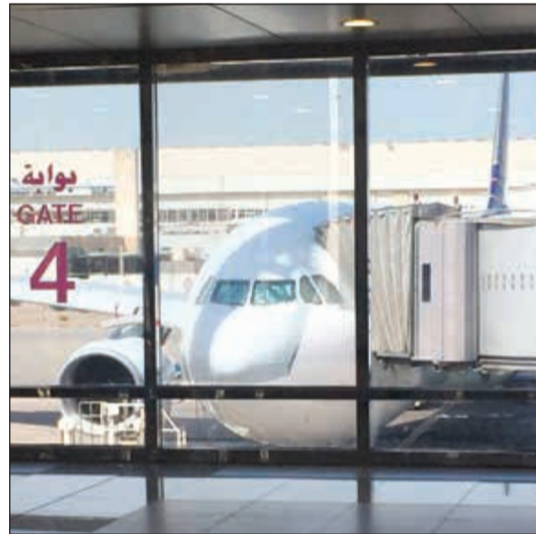
أحدى الطائرات بمطار الكويت الدولي