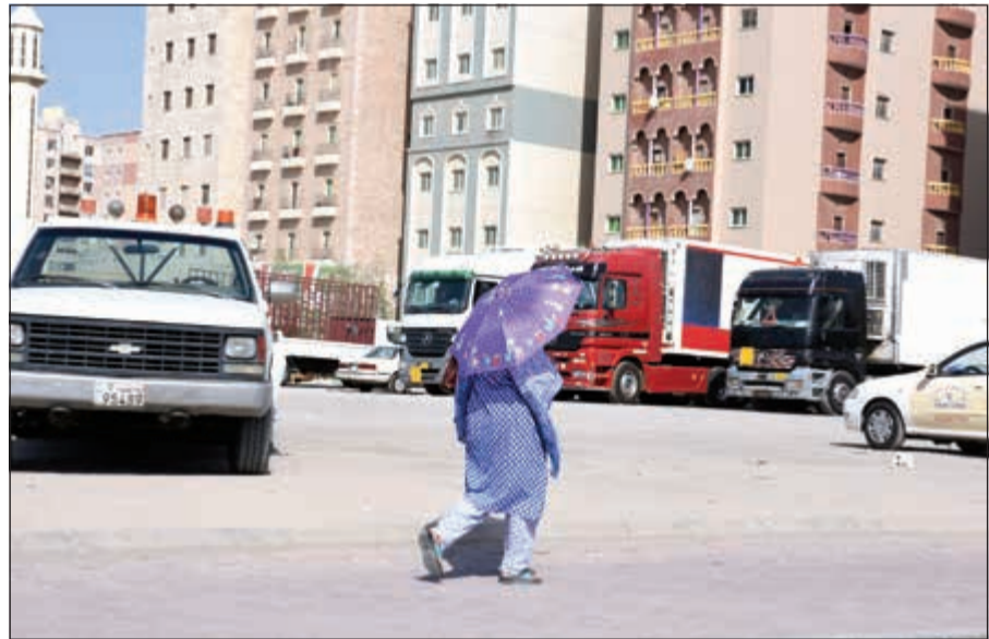
مقيمة تتقي حرارة الشمس المرتفعة بمظلة