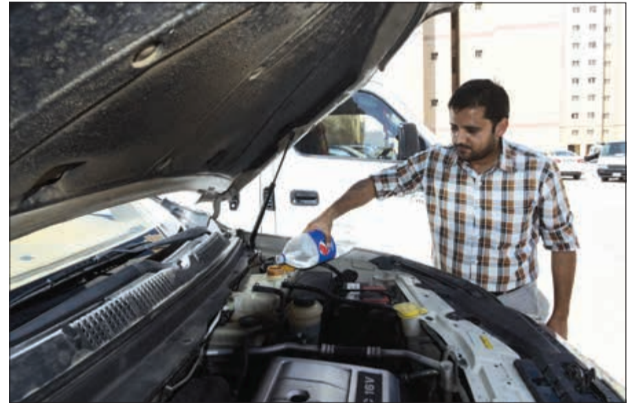
تزويد السيارات بالمياه