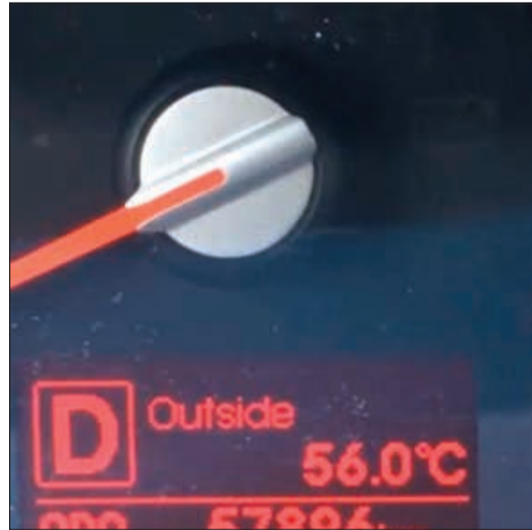
درجة الحرارة 56