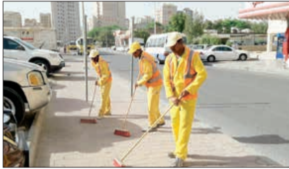
جانب من حملة النظافة