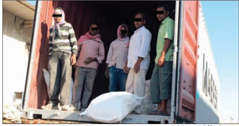
عدد من العمالة التي تم ضبطها

حملة مماثلة شنتها اللجنة في محافظة الأحمدى على العمالة المتسولة خلال الشهر الفضيل أسفرت عن ضبط 4 متسولات يحملن زيارات عائلية وإقامة التحاق بعائل، بالإضافة إلى 2 ممن يعملون في القطاع الأهلي، مشيراً إلى أنه تم اتخاذ الإجراءات القانونية ضدهم وإحالتهم إلى جهات الاختصاص. وأهاب رئيس فريق التفتيش بأصحاب العمل والعمالة إلى ضرورة مراعاة الالتزام بضوابط التشغيل المعمول بها بالبلاد تجنباً للوقوع تحت طائلة القانون.