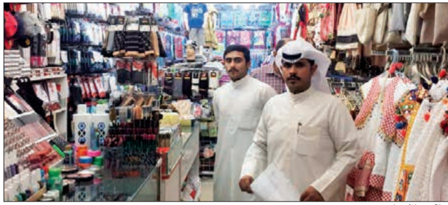
جولة في الأسواق