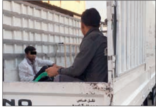
عمال مخالفون لقانون العمل