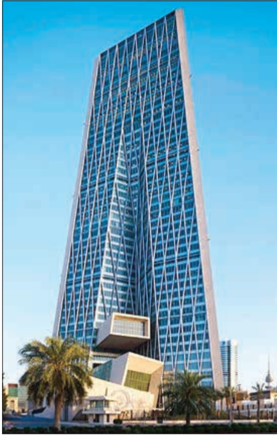
مبنى بنك الكويت المركزي

وشهد إجمالي أصول البنوك تراجعاً بنحو 885 مليون دينار لتسجل 61 مليار دينار مقابل 61,9 مليار دينار بنهاية مارس 2017، وبلغ إجمالي الموجودات الأجنبية للبنوك المحلية نحو 12,1 مليار دينار بتراجع كبير بلغت نسبته 4,6٪ عن مستواها في مارس 2017، وتراجع عرض النقد (ن2) بنحو 0,8٪ ليبلغ 36,4 مليار دينار مقابل 36,7 مليار دينار في نهاية مارس الماضي، وبلغت قيمة المطالبات على القطاع الخاص نحو 36,9 مليار دينار فيما بلغت المطالبات على الحكومة نحو 4,1 مليارات دينار بنهاية إبريل الماضي.