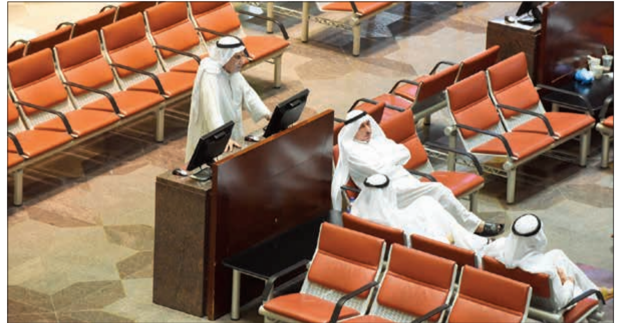
تراجع مؤشرات البورصة وسيولتها في الأسبوع الثاني من رمضان

ورفعت «البترول» سعر بيع الخام إلى شمال غرب أوروبا ليصل إلى سعر تسوية خام «برنت» في بورصة «انتركونتيننتال» مخصصاً منه 4,5 دولارات للبرميل. وحددت سعر بيع الخام العربي الخفيف إلى