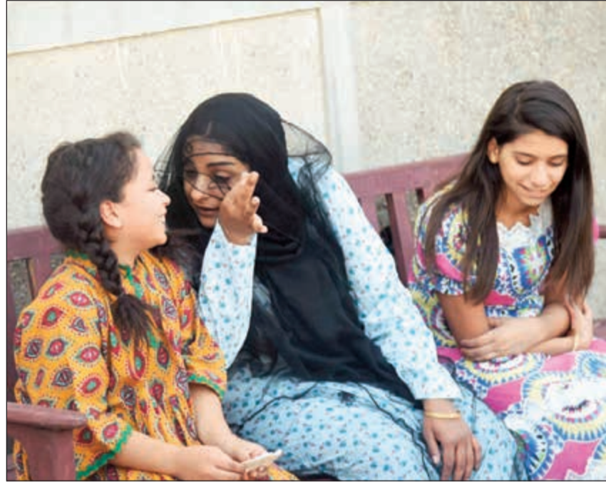
مشهد من مسلسل «كحل أسود قلب أبيض»