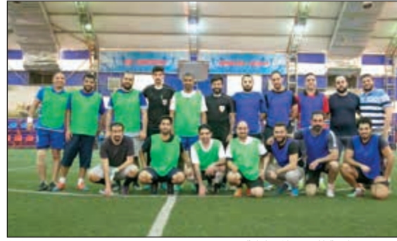
صورة جماعية للفرق المشاركة