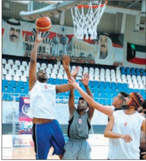
إثارة وندية في المباريات

داون تاون في تحقيق فوز كبير هو الآخر على حساب منافسه فريق الفيغانتنس بنتيجة 14 مقابل 6.