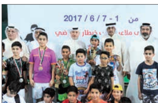
تتويج الفائزين باللقاب

تحت رعاية الهيئة العامة للرياضة ممثلة بإدارة الرياضة للجميع اختتمت بطولة الأشبال الرمضانية المفتوحة للتنس لفتحت 10 و12 سنة والتي أقيمت ملاعب الاتحاد للتنس وملاعب نادي اليرموك بمشاركة 62 لاعبا في المرحلتين يمثلون اندية اليرموك وكاظمة وخبطان والسالمية وأكاديمية Q8 للتنس، حيث شارك في منافسات فردي البراعم تحت 10 سنوات 38 لاعبا، وفي منافسات فردي الأشبال تحت 12 سنة 24 لاعبا.