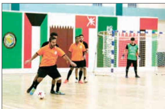
الإثارة عنوان مباريات الدورة