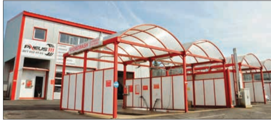
المبنى المراد شراؤه وتحويله إلى مقر مركز الحكمة

الاجتماعي وثقافي خاص، تهدف لغرس العقيدة السليمة في نفوس المسلمين وفقاً لمنهج أهل السنة والجماعة، وتعليم القرآن الكريم للمهتدين الجدد، والعناية بالأسرة والشباب، والتعريف بالإسلام، بالإضافة إلى كتابة عقود