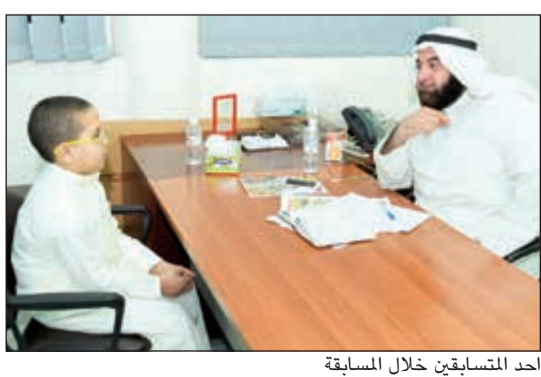
أحد المتسابقين خلال المسابقة

لندرته، لذا قمنا بتوزيع الطرود الغذائية عليهم وبذلك يكون المتبرع الكريم لم يفرط بصدقته شخصاً إنما عائلة كاملة. وتابح: حرصنا في هذا الشهر الفضيل أن نسعد هؤلاء الضعفاء وننال كذلك أجر وفضل إفطار الصائم فلقد قال رسولنا الكريم ﷺ: «من فطر صائماً كان