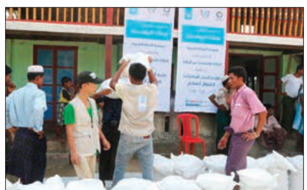
جانب من المساعدات المقدمة إلى مسلمي بورما