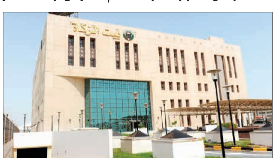
مبنى بيت الزكاة

8 - يجب على المصدق (الساعي) تجنب الأخذ من نفائس الأموال وربيتها، فليس له أخذ الغالية كالحامل والإبن وفحل والغنم ولا يأخذ المعيبة كالهزيلة والمریضة ويجوز له أخذ الأعلى مما يجب إن طابت به نفس صاحب المال. 9 - تعتبر الخلطة في الأنعام سواء كانت خلطة لمشاع (الاشتراك في الملكية) أو خلطة جوار ولو كان لأي من الخليطين أقل من نصاب. وخلطة الجوار تتحقق بوحدة الخدمات الأساسية التي تقدم للماشيتين سواء قدمت من شخص أو أكثر أو من جهة. 10 - الأنعام (الإبل والبقر والغنم) وغيرها من الحيوانات والطيور والأسماك والحشرات وغيرها إذا اتخذت للتجارة وبلغت نصاب عروض التجارة وحال عليها الحول فإنها تزكى زكاة عروض التجارة بشروطها.