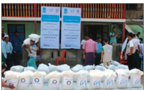
المساعدات المقدمة إلى مسلمي بورما

له مثل أجره غير أنه لا ينقص من أجر الصائم شيئاً» وبفضل الله جل وعلا ثم تبرعات أهل الكويت ادخلنا السرور على عشرات الأسر الفقيرة. واختتم السحب بشكر محسنين ومحسنات الكويت متمنياً تعاونهم ودعمهم المبارك لكافة أعمال ومشاريع